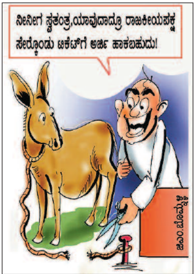
ನೀನೀಗ ಸ್ವತಂತ್ರ,ಯಾವುದಾದ್ರೂ ರಾಜಕೀಯಪಕ್ಷ ಸೇರೋಂದು ಟಿಕೆಟ್‌ಗೆ ಅರ್ಜಿ ಹಾಕಬಹುದು!