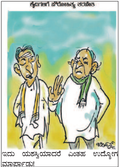
ಇದು ಯಶಸ್ವಿಯಾದರೆ ಎಂತಹ ಉದ್ಯೋಗ ಮಾರ್ಪಾಡು!