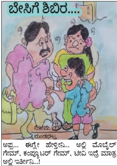
ಅಪ್ಪ... ಈಗ್ಗೆ ಹೇಳ್ತೀನಿ... ಅಲ್ಲಿ ಮೊಬೈಲ್ ಗೇಮ್, ಕಂಪ್ಯೂಟರ್ ಗೇಮ್, ಟಿವಿ ಇದ್ದ ಮಾತ್ರ ಅಲ್ಲಿ ಇರ್ತೀನಿ...!