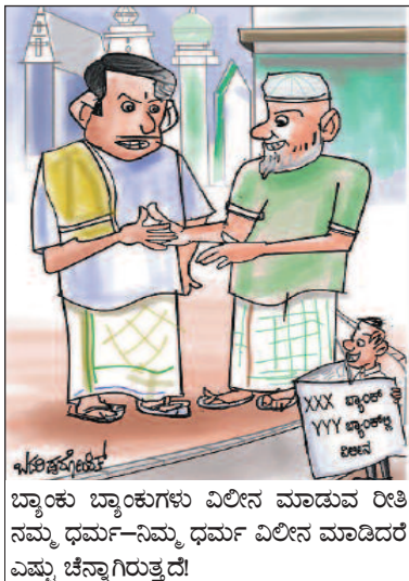
ಬ್ಯಾಂಕು ಬ್ಯಾಂಕುಗಳು ವಿಲೀನ ಮಾಡುವ ರೀತಿ ನಮ್ಮ ಧರ್ಮ-ನಿಮ್ಮ ಧರ್ಮ ವಿಲೀನ ಮಾಡಿದರೆ ಎಷ್ಟು ಚೆನ್ನಾಗಿರುತ್ತದೆ!