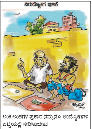
ಅಂಕಿ ಅಂಶಗಳ ಪ್ರಕಾರ ನಮ್ಮನ್ನೂ ಉದ್ಯೋಗಿಗಳ ಪಟ್ಟಿಯಲ್ಲಿ ಸೇರಿಸಿರಬೇಕು!