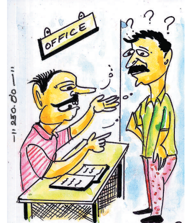
ಒಂದು ದಿನ ನಿಮ್ಮ ಮನೆಯ ಗ್ಯಾಸ್ ಕೊಡು, ನಿನ್ನ ಕೆಲಸ ಈಗಲೇ ಮಾಡ್ತೇನೆ!