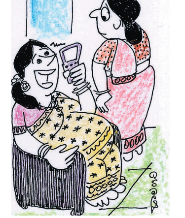
ಛೇ.. ಛೇ.. ಅತ್ತೇನ ವ್ಯದ್ಯಾಕ್ರಮಕ್ಕೆ ಕಳಿಸಿಲ್ಲಪ್ಪಾ... ಇನ್ನೂ ನನ್ನ ಬಾಣಂತನವೇ ಆಗಿಲ್ಲ..!