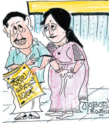
ಇನ್ನುಂದೆ ನೀ ಹೇಳಿದ್ದೆಲ್ಲಾ ತರೋಕೆ... ಕೇಳಿದ್ದೆಲ್ಲಾ ಕೊಡಿಸೋಕೆ ಆಗಲ್ಲೇ. 'ಸಕಾಲ' ಬಂದಿದೆ ಹುಷಾರಾಗಿರಬೇಕು..!