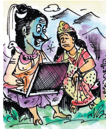
ನನ್ನ ಭಕ್ತನಿರುವ ಜಾಗವನ್ನು ನಿಖರವಾಗಿ ತಲುಪಲು ಈ 'ಗೂಗಲ್' ವ್ಯವಸ್ಥೆಯಲ್ಲಿ ಹುಡುಕುತ್ತಿದ್ದೇನೆ.. ದೇವಿ!