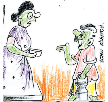
ಅಮ್ಮಾ, ನೀವು ನನ್ನನ್ನು ನಂಬಿ; ನನ್ನ ಹಾಲಿನಲ್ಲಿ ನೀರನ್ನು ಬಿಟ್ಟು ಬೇರೆ ಯಾವುದೇ ಕಲಬೆರಕೆ ಇಲ್ಲ!