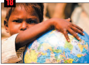
18 ಎಪ್ರಿಲ್ 22 'ವಿಶ್ವ ಭೂ ದಿನ'