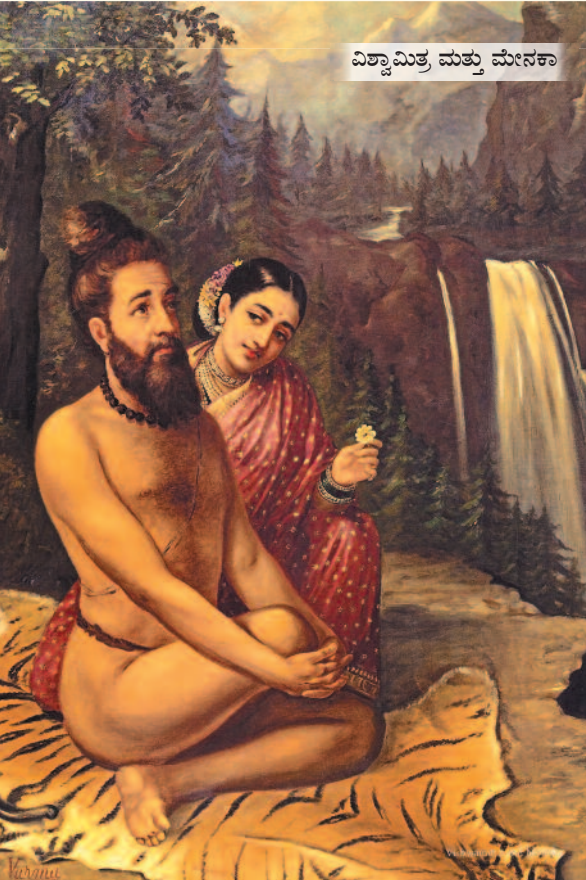
ವಿಶ್ವಾಮಿತ್ರ ಮತ್ತು ಮೇನಕಾ

ಚಿತ್ರ ಕೃಷಿ: 'ರಾಜಾ ರವಿವರ್ಮ: ದಿ ಪೇಂಟರ್ ಪಿನ್ಸ್' ಕೃತಿ, ಲೇಖಕ: ಪರ್ಶ್ರಾಮ್ ಮಂಗರಾಮ್