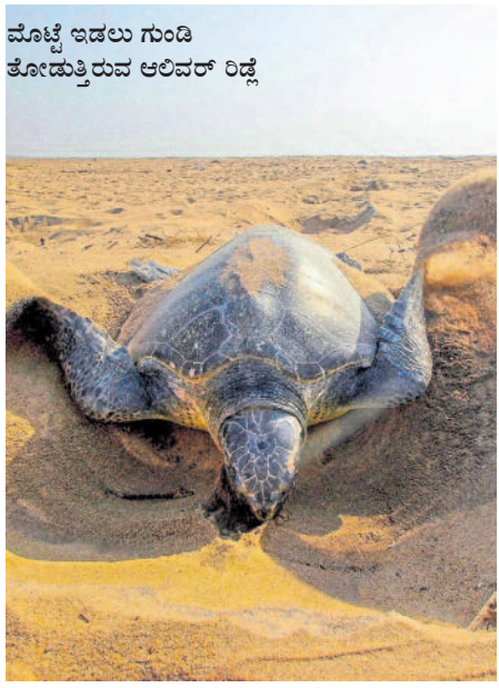
ಮೊಟ್ಟೆ ಇಡಲು ಗುಂಡಿ ತೋಡುತ್ತಿರುವ ಆಲಿವರ್ ರಿಡ್ಡೆ