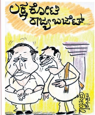
ಆದ್ರೂ ಬಜೆಟ್‌ನಲ್ಲಿ 'ರೆಸಾರ್ಟ್ ಅಭಿವೃದ್ಧಿ' ಗೆ ಸ್ವಲ್ಪ ಹಣ ಕೊಡಬಹುದಿತ್ತು!