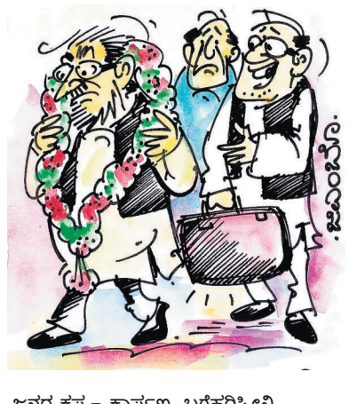
ಜನರ ಕಷ್ಟ- ಕಾರ್ಪಣ್ಯ ಬಗೆಹರಿಸೋನಿ ಅಂತಿದ್ದಾನೆ! ಪಾವ.. ಈಗಷ್ಟೇ ರಾಜಕೀಯಕ್ಕೆ ಬಂದಿದ್ದಾನೆ...