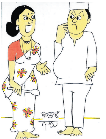
ಮೊದಲು 'ವರಪ್ಪ' ಅಂತಿರೋ ನಿಮ್ಮ ಹೆಸರನ್ನು ಬದಲಿಸಿಕೊಳ್ಳಿ, ಆಮೇಲಾದ್ರೂ ಜನ ಓಟು ಹಾಕ್ತಾರೋ ನೋಡೋಣ!