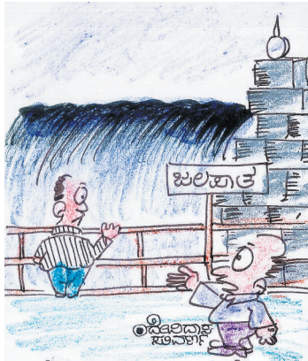
ಸಾರ್! ಬಹಳ ಮುಂದಕ್ಕೆ ಹೋಗಬೇಡಿ, ಸಾಯಂಕಾಲ ನಿಮಗೆ ಸನ್ಮಾನ ಇದೆ!