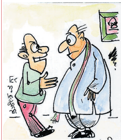
ನಿಮ್ಮ ಬೆಂಬಲಿಗ ಶಾಸಕರ ಸಭೆ ನಡೆಸುವ ಪೂರ್ವದಲ್ಲಿ, ನಿಮ್ಮ ಬೆಂಬಲಿಗ ಮರಾಢೀಶರ ಸಭೆ ನಡೆಸುವುದು ಒಳ್ಳೆಯದು ಸಾರ್!