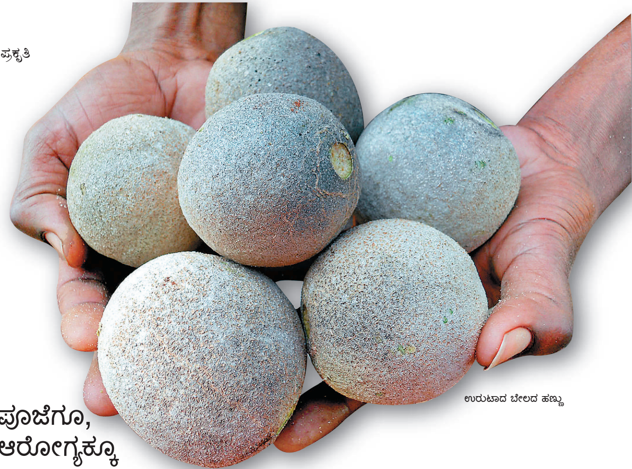
ಉರುಟಾದ ಬೇಲದ ಹಣ್ಣು