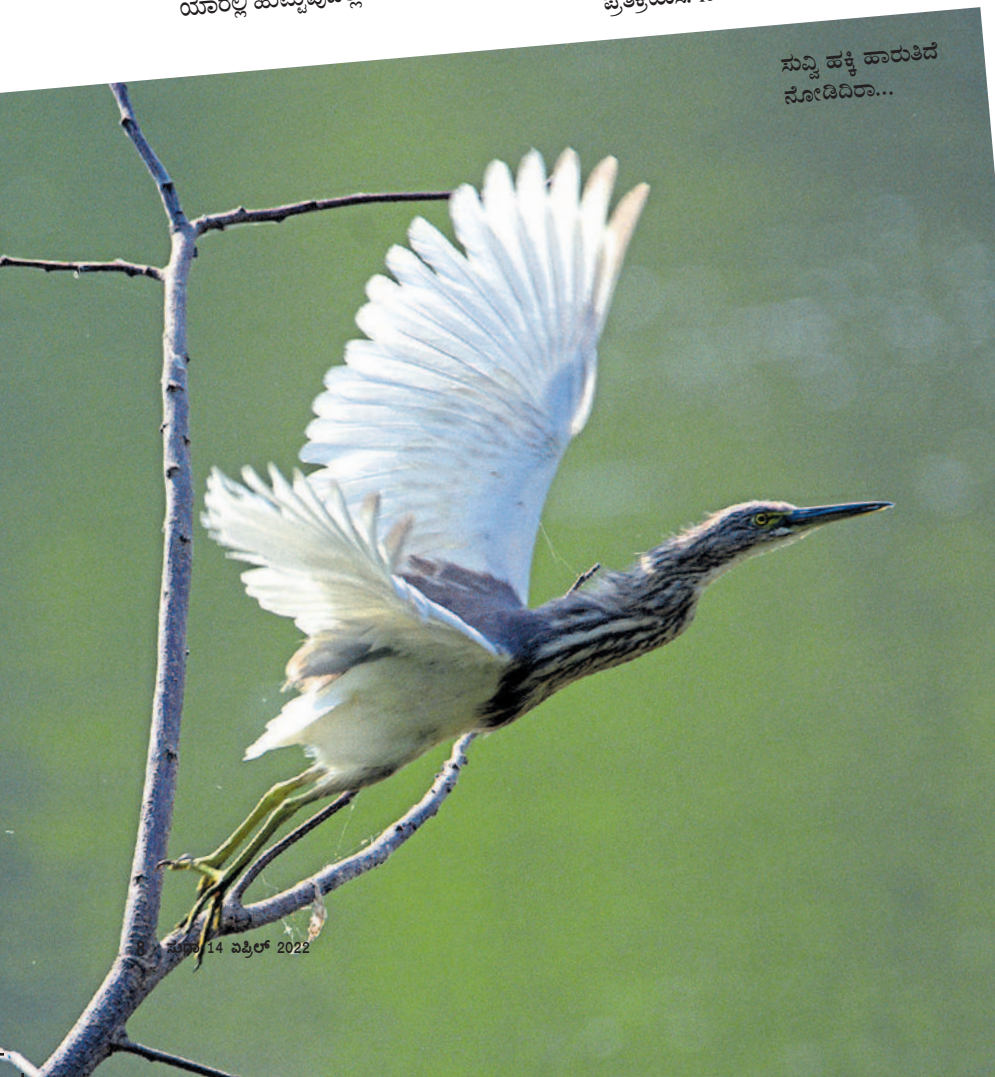
ಸುವಿ ಹಕ್ಕಿ ಹಾರುತ್ತಿದೆ ನೋಡಿರಾ...