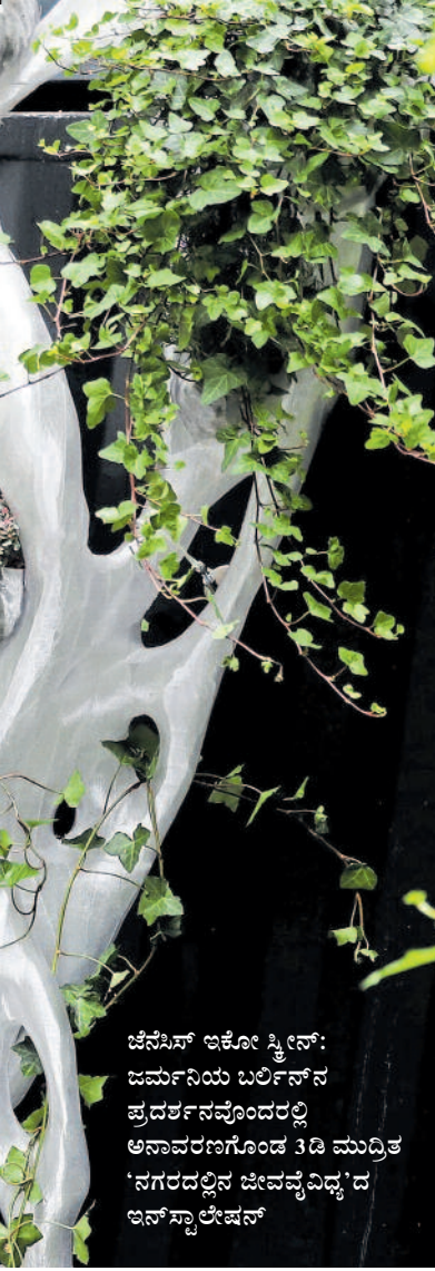
ಜೆನೆಸಿಸ್ ಇಕೋ ಸ್ಟ್ರೀನ್: ಜರ್ಮನಿಯ ಬರ್ಲಿನ್ ನ ಪ್ರದರ್ಶನವೊಂದರಲ್ಲಿ ಅನಾವರಣಗೊಂಡ 3ಡಿ ಮುದ್ರಿತ 'ನಗರದಲ್ಲಿನ ಜೀವವೈವಿಧ್ಯ'ದ ಇನ್ ಸ್ಟಾಲ್ಲೇಷನ್

ಸಾವಿರ ವೆಂಟಿಲೇಟರ್ ಭಾಗಗಳನ್ನು ಮುದ್ರಿಸಿ ಕೊಟ್ಟು, ಲಕ್ಷಾಂತರ ಜನರ ಪ್ರಾಣ ಕಾಪಾಡುವಲ್ಲಿ ನೆರವಾಗಿದ್ದವು. ವೆಂಟಿಲೇಟರ್‌ಗೆ ಸಂಬಂಧಿಸಿದ 12 ವಿವಿಧ ಭಾಗಗಳನ್ನು ಮುದ್ರಿಸಿ ಕೊಟ್ಟ ಕಂಪನಿಗಳು ಹತ್ತು ಸಾವಿರ ವೆಂಟಿಲೇಟರ್‌ಗಳ ಸೃಷ್ಟಿಗೆ ಕಾರಣವಾಗಿದ್ದವು. ಆಮ್ಲ ಜನಕ ನಳಿಕೆ, ಉಚ್ಚಾಸ ನಿಶ್ಚಾಸದ ಜೋಡಣೆಗಳು ಮತ್ತು ಸೊಲನಾಯ್ಡ್ (ಸುರುಳಿ ಅಯಸ್ಕಾಂತ) ಗಳನ್ನೂ 3ಡಿ ಪ್ರಿಂಟಿಂಗ್ ಮೂಲಕ ಮುದ್ರಿಸಲಾಗಿತ್ತು.