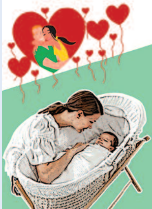
ಕನಿಷ್ಠ ಒಂಬತ್ತು ತಿಂಗಳು.