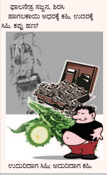
ಉದುರಿದಾಗ ಸಿಹಿ; ಅದುರಿದಾಗ ಕಹಿ.