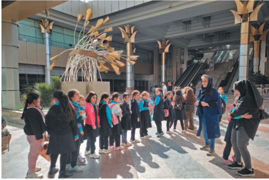
ತೆಹರಾನಿಗೆ ಪ್ರವಾಸ ಬಂದಿದ್ದ ಶಾಲಾ ಮಕ್ಕಳು

ಇದಕ್ಕೆ ಪ್ರತಿಯಾಗಿ ಭಾರತವು ಇರಾನಿನಿಂದ ತತ್ವಜ್ಞಾನವನ್ನು ಗಣಿತವನ್ನು ಕಾವ್ಯವನ್ನು ಅನುವಾದಿಸಿಕೊಂಡಿತು. ಕರ್ನಾಟಕದ ಬಿದರಿ ಕುಶಲಕಲೆ, ಕಾಶ್ಮೀರದ ರತ್ನಗಂಬಳಿ ಕಲೆ ಇರಾನಿನಿಂದ ಬಂದವು. ಡಿಬಿಜಿಯವರು ಉಮರ