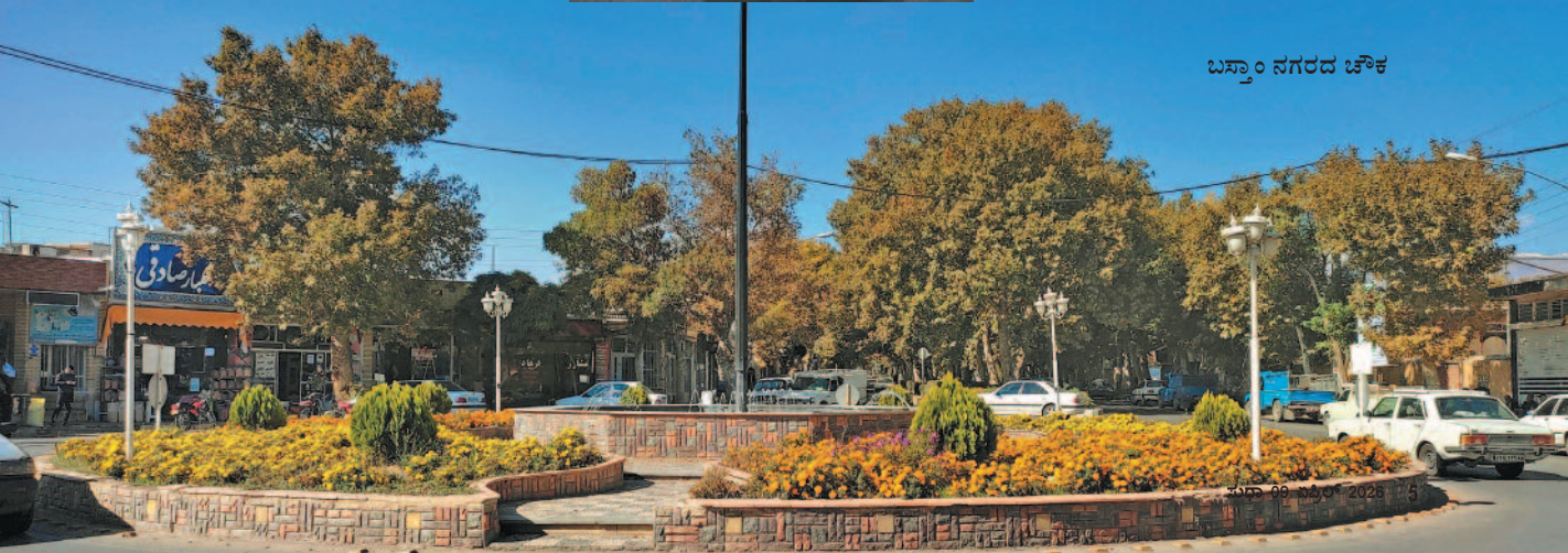
ಬಸ್ತಾಂ ನಗರದ ಚೌಕ

ಖಿಯಾಮನ ಒಸಗೆಯನ್ನು ಅನುವಾದಿಸುವಾಗ, ಅವನ ದರ್ಶನವು ವೇದಾಂತ ತತ್ವಕ್ಕೆ ಹತ್ತಿರವಾಗಿದೆ ಎನ್ನುತ್ತಾರೆ. ಬೇಂದ್ರೆಯವರು ಕೂಡ ಉಮರನನ್ನು ಕನ್ನಡಿಸಿದರು. ಉಮರನ ರೂಪಾಂತರವಾಗಿರುವ ಅವರ ಬೆಳಗುಜಾವ ಕವನದಲ್ಲಿ, 'ಈ ತುಂಬಿ ಬಾಳು ತುಂಬಿರುವ ತನಕ ತುಂತುಂಬಿ ಕುಡಿಯಬೇಕು' ಎಂಬ ಸಾಲಿದೆ. ಉಮರನ ಚಾರ್ವಾಕ ಪ್ರಜ್ಞೆಯ ಜೀವನಪ್ರೀತಿ ಬೇಂದ್ರೆಯವರಿಗೆ ಪ್ರಿಯವಾಗಿತ್ತು. ಪ್ರಾಚೀನ ಜಗತ್ತಿನಲ್ಲಿ ಗ್ರೀಸ್ ಬಿಟ್ಟರೆ ಜಗತ್ತಿನಲ್ಲಿ ಅತಿಹೆಚ್ಚು ತತ್ವಜ್ಞಾನಿಗಳು, ಕವಿಗಳು, ವಿಜ್ಞಾನಿಗಳು ಇರಾನಿನಲ್ಲಿ ಮೂಡಿದರು. ಹಫೀಜ್ ಉಮರ್ ಸಾದಿ ಫಿರ್ದೋಸಿ ಅವರ ಪ್ರಮುಖ ಕವಿಗಳು. 11ನೇ ಶತಮಾನದಲ್ಲಿದ್ದು ಶಾಹನಾಮ ಬರೆದ ಫಿರ್ದೋಸಿ ಇರಾನಿಗರ ಪ್ರಿಯ ಕವಿ. ಅವರಿಗೆ ತಮ್ಮ ದಾರ್ಶನಿಕರು ಹಾಗೂ ಕವಿಗಳ ಬಗ್ಗೆ ಗೌರವ. ಫಿರ್ದೋಸಿಯ ಪ್ರತಿಮೆ ನಿಲ್ಲಿಸಿ, ಅವನ ಸಮಾಧಿಯನ್ನು ಪ್ರೇಕ್ಷಣೀಯ ಸ್ಥಳವನ್ನಾಗಿ ಮಾಡಿದ್ದಾರೆ. ತೆಹರಾನಿನ ಮೀಲಾದ್ ಟವರಿನ ಕೊನೆಯ ಅಂತಸ್ತಿನಲ್ಲಿ, ಇರಾನಿನ ಎಲ್ಲ ದಾರ್ಶನಿಕರ, ಕವಿಗಳ, ವಿಜ್ಞಾನಿಗಳ, ಕ್ರೀಡಾಪಟುಗಳ ಪಟಗಳನ್ನಿಟ್ಟು, ಅವರ ಚರಿತ್ರೆಯನ್ನು ಸಂಕ್ಷಿಪ್ತವಾಗಿ ದಾಖಲಿಸಿದ್ದಾರೆ. ಸೂಫಿ ಕವಿಗಳ ಚಿತ್ರಪಟಗಳ ಬದಿ ಅವರ ಕಾವ್ಯದ