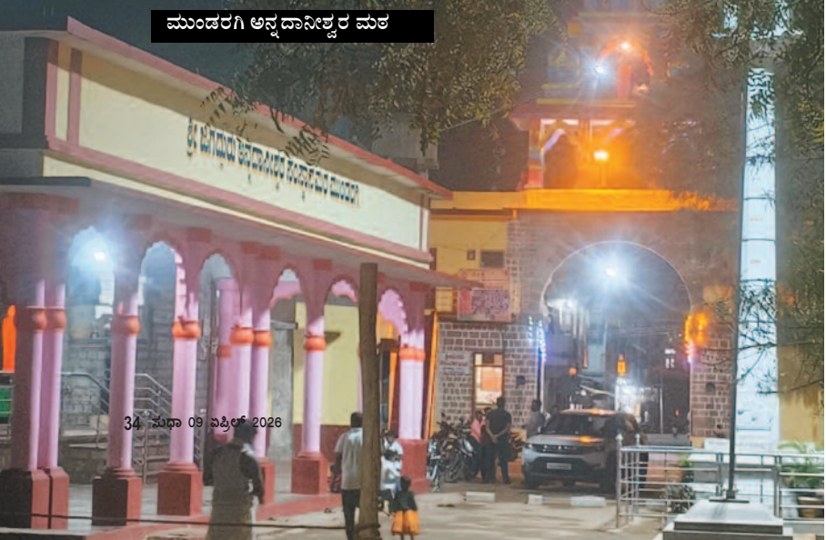
ಮುಂಡರಗಿ ಅನ್ನದಾನೀಶ್ವರ ಮಠ