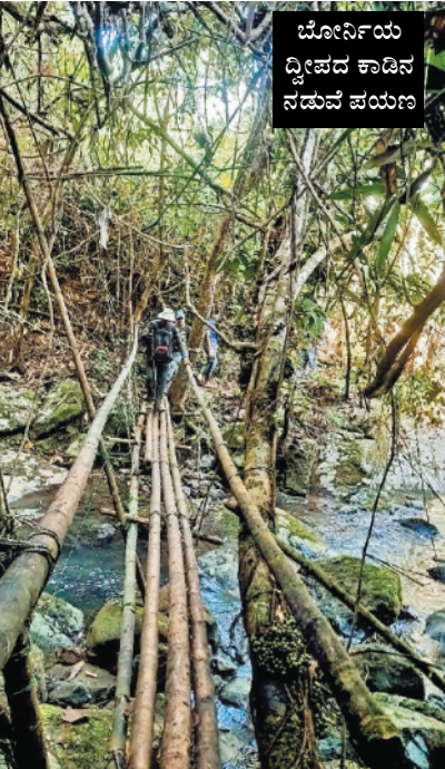
ಬೋರ್ನಿಯ ದ್ವೀಪದ ಕಾಡಿನ ನಡುವೆ ಪಯಣ

ಸುಮಾರು ಒಂದು ಗಂಟೆ ರಸ್ತೆ ಪ್ರಯಾಣದ ನಂತರ ಮುಂದೆ ದಟ್ಟ ಕಾಡು ಪ್ರದೇಶ. ಅಲ್ಲಲ್ಲಿ ಪಾಮ್ ತೋಟಗಳು, ಮುಂದಕ್ಕೆ ರಕ್ಷಿತರಣ್ಯಕ್ಕೆ ಕಾಲನಡಿಗೆಯಲ್ಲಿ ಹೋಗಬೇಕು. ಅಷ್ಟೇನೂ ಕಡಿದಾದ ಬೆಟ್ಟವಲ್ಲದಿದ್ದರೂ ಹರಿಯುವ ನೀರಿನ ಹಳ್ಳ ಕೊಳ್ಳಗಳನ್ನು ದಾಟಿ ಗಿಡಗಂಟೆಗಳ ಮಧ್ಯೆ ಸುಮಾರು ಎರಡು ಗಂಟೆ ಕಾಲ ಕ್ಯಾಮೆರಾ ಉಪಕರಣಗಳನ್ನು ಹೊತ್ತುಕೊಂಡು ಹೋಗಲು ಶ್ರಮದ ಕೆಲಸವೇ. ನನ್ನ ಜೊತೆ ನಮಗೆ ತಿಂಡಿ, ಊಟ, ನೀರು ಇತ್ಯಾದಿಗಳನ್ನು ಹೊತ್ತುಕೊಂಡು ಬರುವ ಅಲ್ಲಿಯ ಸ್ಥಳೀಯ ಜನ ಇಬ್ಬರಿದ್ದರು. ಅಂತೂ ನಿಯೋಜಿತ ಜಾಗ ಬಂತು.