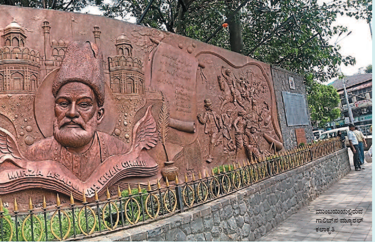
ಮುಂಬಯಿಯಲ್ಲಿರುವ ಗಾಲಿಬ್‌ನ ಮ್ಯೂರಲ್ ಕಲಾಕೃತಿ

ದಡಕಪ್ಪಳಿಸಿ ಚುಂಬಿಸುವ ಕಡಲೆಗಳ ಮೊರೆವ ಯಾನ; ಹಸಿರೆಲೆಗಳ ಮರೆಯಿಂದ ಇಣುಕಿ ಹರಿಸುವ ಗಿಳಿ ಕೋಗಿಲೆಗಳ ರಸಗಾನ. ಒಡಲೊಳಗಿಳಿಸಿಕೊಂಡ ಮದಿರೆಯ ನಿಶಾಗಾನ.