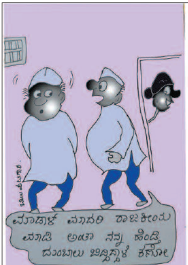
ಮಾಡಾಜ್ ಮಗರಿ ರಾಜಕೀಯ ಮಾಡಿ ಅಂತ ನನ್ನ ಹಿಂದಿ ದುಂಬುಲಿ ಇಟ್ಟುಕೊಳ್ಳೋ