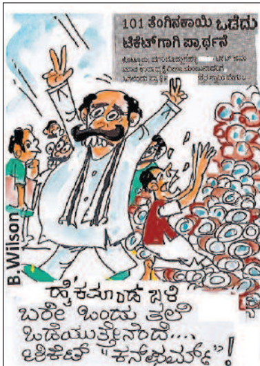
ದೈವಸೂತ್ರದ ಸಲಿ ಬರೇ ಇಂದು ತಲೆ ಹಿಡೆಯು ಪ್ರಸಾರವಿದೆ... ಆರಿಕೆಡ್ 'ಕನಫುಮ್'!