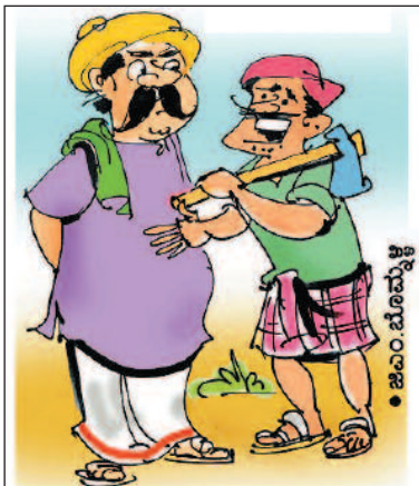
ರಾಜಕೀಯ ಸಭೆಗಳಿಗೆ ಹೋದರೆ ಊಟವನ್ನೂ ಹಾಕಿ, ದುಡ್ಡೂ ಕೊಟ್ಟು ಕಳಿಸ್ತಾರೆ ಯಜಮಾನೇ!