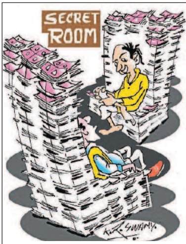
ಚುನಾವಣೆಯ ತಯಾರಿ... ಇಷ್ಟು ಸಾಕಾ?