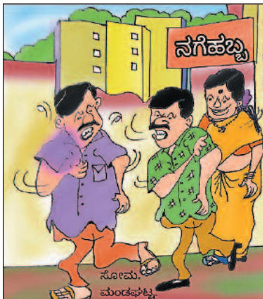
ನಗೆಹಬ್ಬ ಕಾರ್ಯಕ್ರಮ ಬಹಳ ಚೆನ್ನಾಗಿತ್ತು ಕಣೋ... ಆದರೆ ನನ್ನ ಹೆಂಡತಿ ಇದ್ದಿದ್ದಿಂದ ಹೆಚ್ಚು ನಗ್ಗಿಕ್ಕೆ ಆಗಿಲ್ಲ ಮಾರಾಯ!