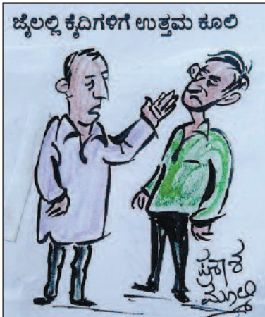
ಇದಕ್ಕೂ ಕ್ಯಾಂಪಸ್ ಸೆಲೆಕ್ಷನ್ ಅಂತ ಇದೆ, ಜನ ಮುಗಿ ಬಿಳುವುದು ಖಂಡಿತ!