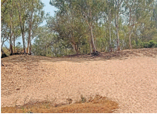
ತಲಕಾಡನ್ನು ಆವರಿಸಿರುವ ಮರಳ ರಾಶಿ