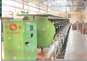
ತಿ.ನರಸೀಪುರದ ಕೆಎಸ್‌ಐಸಿ ನೂಲು ತೆಗೆಯುವ ಕಾರ್ಖಾನೆ

Industries Corporation—KSIC) ಅಡಿಯಲ್ಲಿ ತಂದಿತು. ಒಟ್ಟಿನಲ್ಲಿ, ಟಿಪ್ಪು ಸುಲ್ತಾನರ ಕಾಲದಲ್ಲಿ ಆರಂಭವಾದ ರೇಷ್ಮೆ ಕೃಷಿ ತರುವಾಯ ಒಡೆಯರ್ ಅರಸರ ಆಶ್ರಯದಲ್ಲಿ ಕರ್ನಾಟಕ, ಅದರಲ್ಲೂ ಮುಖ್ಯವಾಗಿ ಮೈಸೂರಿನ ಸಾಂಸ್ಕೃತಿಕ ಮತ್ತು ಆರ್ಥಿಕ ಸಂಕೇತವಾಗಿ ಬೆಳೆಯಿತು.