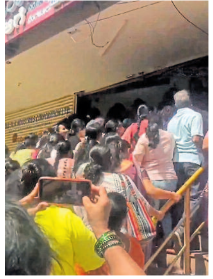
ರೇಷ್ಮೆ ಸೀರೆ ಖರೀದಿಸಲು ಬೆಂಗಳೂರಿನ ಕೆಎಸ್‌ಐಸಿ ಮಳಿಗೆಗೆ ಮುಗಿಬಿದ್ದಿದ್ದ ಮಹಿಳೆಯರು

ಬೆಂಗಳೂರು, ಮೈಸೂರು, ದಾವಣಗೆರೆ, ಚನ್ನಪಟ್ಟಣ, ಹೈದರಾಬಾದ್ ಸಹಿತ 14 ಮಾರಾಟ ಮಳಿಗೆಗಳನ್ನು ಕೆಎಸ್‌ಐಸಿ ಹೊಂದಿದೆ. ಬೆಂಗಳೂರಿನಲ್ಲಿ ಆರು (ಎಂ.ಜಿ. ರಸ್ತೆಯ ಜುಬಿಲಿ ಶೋರೂಂ, ಗಾಂಧಿ ಬಜಾರ್, ಮಲ್ಲೇಶ್ವರಂ, ಬಸವೇಶ್ವರ ನಗರ, ಕೆ.ಜಿ. ರಸ್ತೆ, ಡಿ.ವಿ.ಜಿ. ರಸ್ತೆ ಜಯನಗರ) ಮಾರಾಟ ಮಳಿಗೆಗಳಿವೆ. ಮೈಸೂರಿನಲ್ಲಿ ಐದು (ಮೈಗಾಲಯ ಎದುರು, ಯಾತ್ರಿ ನಿವಾಸ್, ಕೆ.ಆರ್.ವೃತ್ತ, ಮಾನಂದವಾಡಿಯ ಫ್ಯಾಕ್ಟರಿ ಆವರಣ) ಮಳಿಗೆಗಳಲ್ಲಿ ಖರೀದಿಗೆ ಅವಕಾಶವಿದೆ. ಉಳಿದಂತೆ ದಾವಣಗೆರೆ, ಚನ್ನಪಟ್ಟಣ, ಬೆಂಗಳೂರಿನ ವಿಮಾನ ನಿಲ್ದಾಣ ಆವರಣದಲ್ಲಿ ಒಂದೊಂದು ಮಳಿಗೆಗಳಿವೆ.