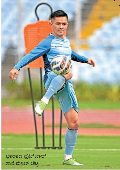
ಭಾರತದ ಫುಟ್‌ಬಾಲ್ ತಾರೆ ಸುನಿಲ್ ಚೆಟ್ಟಿ