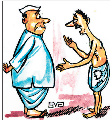
ಬೆಲೆ ಇಳಿಸೋಕೆ ಸಾಧ್ಯವಾಗದೆ ಹೋದೆ ಪರವಾಗಿಲ್ಲ ಬಿಡಿ. ಪದಾರ್ಥಗಳನ್ನು ಕೊಂಡೊಕ್ಕೋಕೆ ಹಣವನ್ನಾದ್ರೂ ಸರ್ಕಾರದ ಕಡೆಯಿಂದ ಕೊಡ್ಡಿ ಬುದ್ಧಿ..