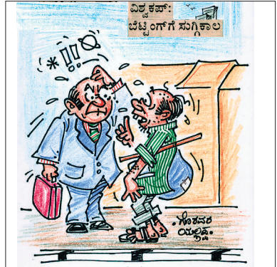
ಸ್ವಾಮಿ, ಮರ್ಯಾದೆ ಕೊಟ್ಟು ಮಾತನಾಡಿ.. ನಾನೂ ಕೂಡ ಭಾರಿ ಶ್ರೀಮಂತನಾಗಿದೆ.. ಹೋದ ವಿಶ್ವ ಕಪ್ ಕ್ರಿಕೆಟ್‌ನಲ್ಲಿ ಭಾರತ 'ವಿಶ್ವ ಕಪ್ ಗೆಲ್ಲುತ್ತೆ' ಅಂತ ನನ್ನ ಸಮಸ್ತ ಆಸ್ತಿಯನ್ನೇ ಪಣಕಟ್ಟಿದೆ!