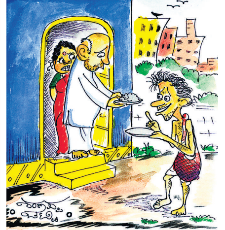
ರೀ ಸ್ವಾಮಿ.. ಹಳಸಿದನ್ನ ನೀಡ್ತಿರೋದು ನೋಡಿದೆ ನಿಮ್ಮ ಸಂಬಂಧವೂ ಹಳಸಿದೆ ಅನ್ನುತ್ತೆ..!