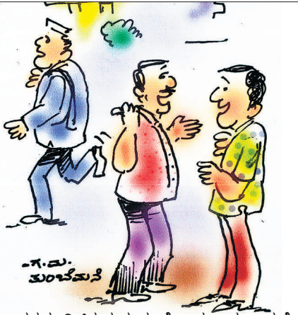
ಇವರದು ವಿಚಿತ ಕುರುಡು ನೋಡು.. ಚುನಾವಣೆ ಮೊದಲು ನಾವೆಲ್ಲ ಕಾಣ್ತೀವಿ.. ನಂತರ ಅವರ ಮಕ್ಕಳು, ಬಂಧುಗಳು ಮಾತ್ರ ಕಾಣ್ತಾರೆ..!