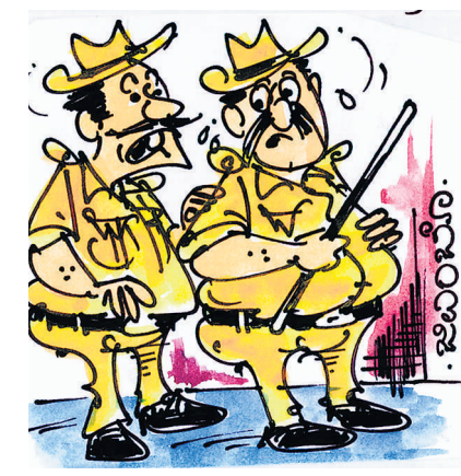
ಅಭ್ಯಾಸದಂತೆ ಆ ನನ್ನ ಗು.. ಈ ನನ್ನ ಗ ಅನ್ನೇಡ, ನಾವು ಹುಡುಕುತ್ತಿರೋದು ಶಾಸಕರ ಮಗ..!