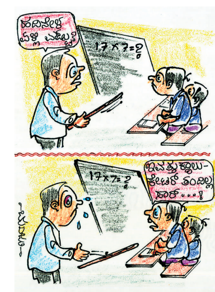
ಇವತ್ತು ಕ್ಷುಲು-ಕೇಟರ್ ತಿಂಜಿಲ್ಲ ಪಾಠ...!