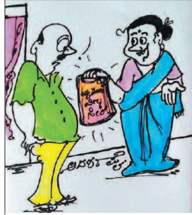
ನಿಮ್ಮ ಮನಸ್ಸು ಇಷ್ಟು ಒಳ್ಳೆಯದು ಅಂತ ಮೊದಲೇ ಗೊತ್ತಿದ್ದಿದ್ರೆ, ಇನ್ನೂ ಎರಡು ಮೂರು ಸೀರೆ... ತರೋದಕ್ಕೆ ಹೇಳ್ತಿದ್ದ ಕಣ್ಣೇ..!