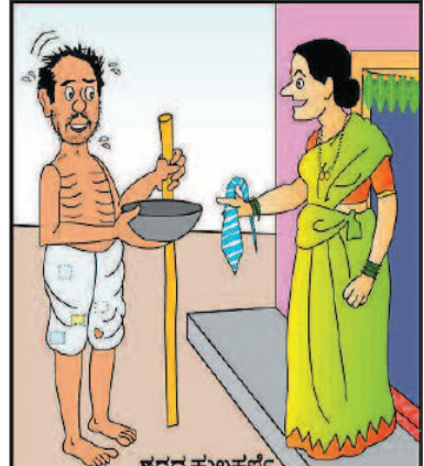
ಯಜಮಾನರ ಯಾವುದಾದ್ದು ಹಳೇ ಬಟ್ಟೆ ಇದ್ದೆ ದಾನ ಮಾಡಿ ಅಂದಿದ್ದಲ್ಲಾ ತಗೋಳಪ್ಪ!