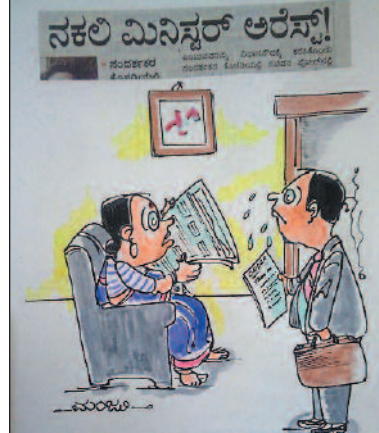
ಜಾಸ್ತಿ ಡಿಮಾಂಡ್ ಮಾಡದ ಟ್ರಾನ್ಸ್‌ಫರ್ ಕೊಟ್ಟಾ? ಹಾಗಾದರೆ ಅವರು ನಕಲಿ ಮಿನಿಸ್ಟ್ರೀ!