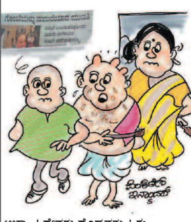
ಅಬ್ಬಾ...! ದೇವರು ದೊಡ್ಡವನು..! ಈ ಪ್ರಪಂಚದಲ್ಲಿ ಒಂದು ಗಂಡು ಹೆಣ್ಣಿಂದ ಬಚಾವ್ ಆದ ಅಂತ ಅನ್ನಿ!