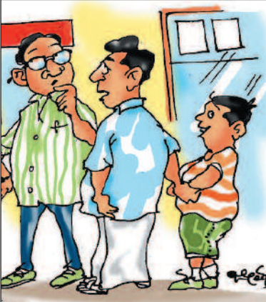
ಈತ ಕೂಡ ಯುದ್ಧ ಬೇಡ ಅಂತಿದ್ದಾನೆ! ಇವನಿಗೆ ಇತಿಹಾಸ ಪಠ್ಯದಲ್ಲಿ ಅದು ಬರೋದು ಇಷ್ಟವಿಲ್ಲ..!