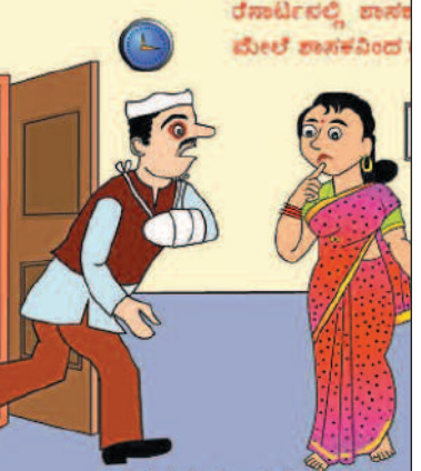
ಆ ಅಪರೇಷನ್‌ನಿಂದ ತಪ್ಪಿಸಿಕೊಳ್ಳಲು ರೆಸಾರ್ಟ್‌ಗೆ ಹೋದ್ರೆ, ಈ ರೀತಿಯ ಆಪರೇಷನ್ ಮಾಡಿಸಿಕೊಂಡು ಬರಬೇಕಾಯಿತು!