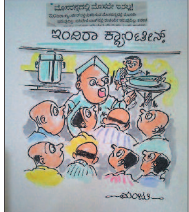
ನಿಮ್ಮ ನಿರೀಕ್ಷೆ ತಪ್ಪು...! ಮೈಸೂರ್‌ಪಾಕನ್ನಲ್ಲಿ ಮೈಸೂರು ಇರುತ್ತೇನಪ್ಪ!