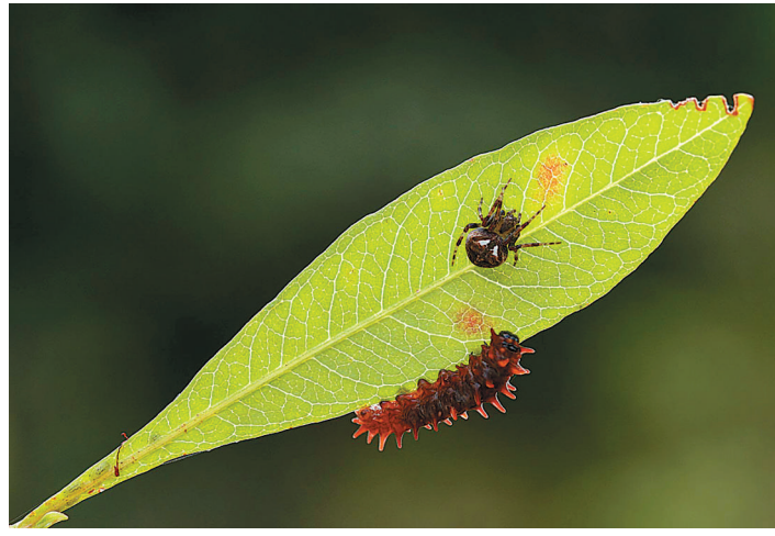
ಚಿಗುರಲೆಯ ಮೇಲೆ ಕಂಡು ಬಂದ ಕ್ರಿಂಸನ್ ರೋಸ್ ಕಂಬಳಿ ಹುಳು ಮತ್ತು ಕಪ್ಪುಬಣ್ಣದ ಜೇಡ.

ಹಸಿರು ಗರಿಕೆ, ಚಿಗುರಿದ ಎಲೆ ಹಾಗೂ ಇಬ್ಬನಿ ಹರಡಿದ ಹೂಗಳ ಮೇಲೆ ಈ ಪುಟ್ಟ ಕೀಟಗಳನ್ನು ನೋಡುವುದು, ಫೋಟೋ ಕ್ಲಿಕ್ಕಿಸುವುದು ಮುದ ನೀಡುವ ಕೆಲಸವೇ ಸರಿ.