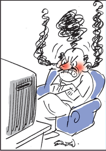
ಟಿವಿ ಒಡೆದುಹಾಕದಷ್ಟಿದ್ದರೆ ಸಾಕು!