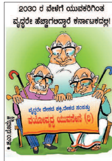
ವೃದ್ಧರೇ ದೇಶದ ಶಕ್ತಿ, ದೇಶದ ಸಂಪತ್ತು ಮಯೋವೃದ್ಧ ಯುವನವೆ (೦)