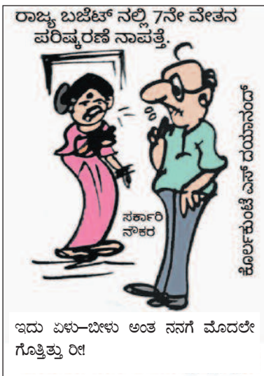
ಇದು ಏಳು-ಬೀಳು ಅಂತ ನನಗೆ ಮೊದಲೇ ಗೊತ್ತಿತ್ತು ರೀ!