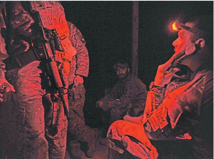
ಅಪಾಯದ ರಾತ್ರಿ ಬೈನಾಕ್ಯುಲರ್ ಶೋಧಕ್ಕೂ ಸಿಗದಂತೆ ಕೆಂಪು ಬಣ್ಣಕ್ಕೆ ತಿರುಗಿಸುವ ಟಾರ್ಚ್

ಹೆಲಿಕಾಪ್ಟರ್‌ನಲ್ಲಿ, ನಾನೂ ಪ್ರಯಾಣ ಮಾಡಿದ್ದೆ. ಅದೂ ಬ್ಲಾಕ್ ಹಾಕ್ (black hawk) ಹೆಲಿಕಾಪ್ಟರ್‌ನಲ್ಲಿ ಪಯಣಿಸುವ ಅವಕಾಶ ನನಗೆ ದೊರೆತಿತ್ತು. ಅದಕ್ಕೂ ಮೊದಲು ಅದನ್ನು ಕೇವಲ ಚಿತ್ರದಲ್ಲಿ ನೋಡಿದ್ದೆ; ಹೆಲಿಕಾಪ್ಟರ್‌ಗಳ ಕುರಿತ 'ಬ್ಲಾಕ್ ಹಾಕ್ ಡೌನ್' (Black Hawk Down) ಸಿನಿಮಾದಲ್ಲಿ ನೋಡಿದ್ದೆ. ಕಲ್ಪನೆಯ ಕನಸಿನಂತಿದ್ದ ಕಾಪ್ಟರ್‌ನಲ್ಲಿ ಜಲಾಲಾಬಾದ್‌ನಿಂದ ಅಮೆರಿಕದ ಸೇನಾ ತುಕಡಿಯಿದ್ದ ಹೊನಾಕರ್ ಮಿರಾಕಲ್‌ಗೆ (Honaker Miracle) ಪ್ರಯಾಣ ಮಾಡಿದೆ. ಅದು ಅಮೆರಿಕ ಇಟ್ಟ ಹೆಸರು.