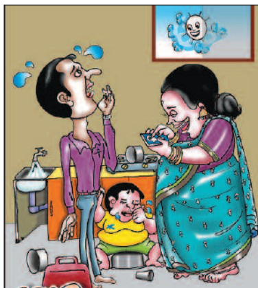
ಪ್ರತಿದಿನ ಪ್ರವಾಸಿ ರಿ! ಸ್ವಲ್ಪ ಸುಮ್ಮಿರಿ...! 'ಮಹಿಳಾ ದಿನಾಚರಣೆ'ಗೆ ನೂರಾರು ಜನ ಶುಭ ಕೋರಿದ್ದಾರೆ. ಅವರಿಗಲ್ಲ ಧ್ವಾಂಕ್ಸ್ ಹೇಳಿದ ಮೇಲೆ ಅಡಿಗೆ ಮಾಡುತ್ತೇನೆ!