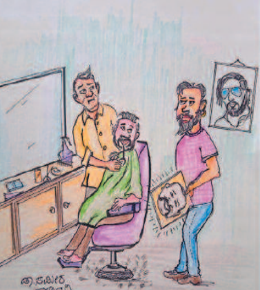
ನನಗೆ 'ರೀಲ್' ಬೇಡ 'ರಿಯಲ್' ಹೀರೊ ಹಾಗೆ ಹೇರ್ ಸ್ಟೈಲ್ ಮಾಡಿ!