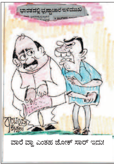
ವಾರೆ ವ್ವಾ ಎಂತಹ ಜೋಕ್ ಸಾರ್ ಇದು!