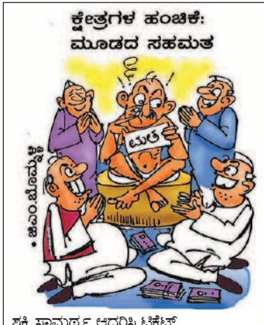
ಶಕ್ತಿ ಸಾಮರ್ಥ್ಯ ಆಧರಿಸಿ ಟಿಕೆಟ್ ಕೊಡ್ತಾರಂತೆ, ಯಾವುದಕ್ಕೂ ನಿನ್ನ ಬೆಂಬಲ ಮುಂಚಿತವಾಗಿರಲಿ!