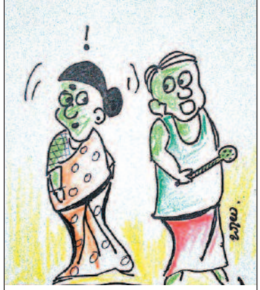
ದಿನಾ ನನ್ನ ಹತ್ತಿರ ಜಗಳವಾಡುವ ಬದಲು, ಭಾರತದ ಗಡಿಗೆ ಹೋಗಿ ಉಗ್ರರ ಜತೆ ಗುದ್ದಾಡು ನೋಡೋಣ!