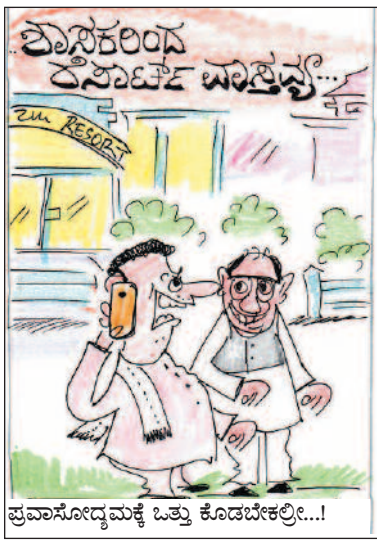
ಪ್ರವಾಸೋದ್ಯಮಕ್ಕೆ ಒತ್ತು ಕೊಡಬೇಕಲ್ಲೀ...!