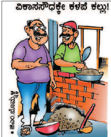
ಈ ಭವ್ಯ ಕಟ್ಟಡ ನನ್ನ ಸ್ವಂತದ್ದು ಕಣಯ್ಯ! ಯಾವುದೂ ಕಳಪೆಯಾಗದಂತೆ ನೋಡಿಕೊಳ್ಳಿ!