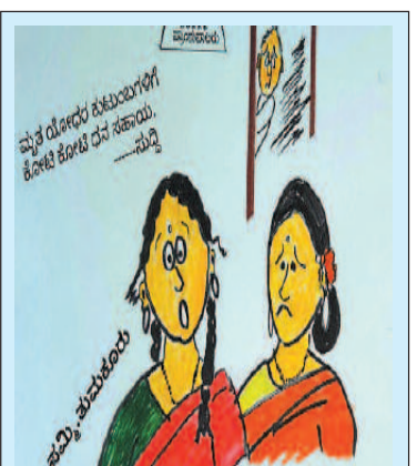
ಅಯ್ಯೋ ಬಿಡಿ ಕಮಲಮ್ಮ ನಮಗೆ ಆ ಅದೃಷ್ಟ ಎಲ್ಲೆತ್ತೆ..!