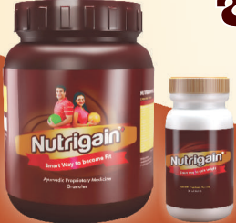
ನ್ಯೂಟ್ರಿಗೇನ್ + ಗ್ಯಾಜಲ್ ನ್ಯೂಟ್ರಿಗೇನ್ + ಕ್ಯಾಪ್ಸೂಲ್

ನೀವು ನ್ಯೂಟ್ರಿಗೇನ್‌ನ ಸದುಪಯೋಗ ಪಡೆದಿದ್ದಲ್ಲಿ ನಿಮ್ಮ ಇತ್ತೀಚಿನ 3 ರಿಂದ 4 ಆಕರ್ಷಕ ಭಾವಚಿತ್ರವನ್ನು ಕಳುಹಿಸಿ ನ್ಯೂಟ್ರಿಗೇನ್ ಜಾಹೀರಾತಿನಲ್ಲಿ ಬರುವ ಅವಕಾಶ ಕಲ್ಪಿಸಿಕೊಳ್ಳಿ.