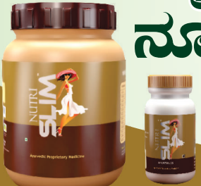
ನ್ಯೂಟ್ರಿಸಿಮ್ ಪೌಡರ್ ನ್ಯೂಟ್ರಿಸಿಮ್ ಕ್ಯಾಪ್ಸೂಲ್

ನೀವು ನ್ಯೂಟ್ರಿಸಿಮ್‌ನ ಸದುಪಯೋಗ ಪಡೆದಿದ್ದಲ್ಲಿ ನಿಮ್ಮ ಇತ್ತೀಚಿನ 3 ರಿಂದ 4 ಆಕರ್ಷಕ ಭಾವಚಿತ್ರವನ್ನು ಕಳುಹಿಸಿ ನ್ಯೂಟ್ರಿಸಿಮ್ ಜಾಹೀರಾತಿನಲ್ಲಿ ಬರುವ ಅವಕಾಶ ಕಲ್ಪಿಸಿಕೊಳ್ಳಿ.