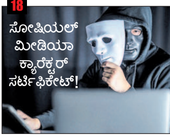
18 ಸೋಷಿಯಲ್ ಮೀಡಿಯಾ ಕ್ಯಾರೆಕ್ಟರ್ ಸೆರ್ಟಿಫಿಕೇಟ್!

ನಿಮ್ಮ ಸಾಮಾಜಿಕ ಜಾಲತಾಣಗಳ ಗೋಡೆ ಸ್ವಚ್ಛವಾಗಿದೆಯೇ? ಈ ಪ್ರಶ್ನೆಯಲ್ಲೇ ಗೋಡೆಯ ಸ್ವರೂಪ ಹಾಳಾಗಿರುವ ಸೂಚನೆ ಇದೆ. ಫೇಸ್‌ಬುಕ್, ಟ್ವಿಟರ್‌ನ ಪುಟಗಳನ್ನು ತೆರೆದುನೋಡಿದರೆ, ಅಲ್ಲಿ ಸಮಾಜದ ಕೊಳಕೆಲ್ಲ ಕಣ್ಣಿಗೆ ರಾಚುವಂತೆ ಕಾಣಿಸುತ್ತದೆ. ಸ್ನೇಹ-ಸಂಬಂಧ, ವಿವೇಕ-ವಿನೋದಕ್ಕೆ ಕಾರಣವಾಗಬೇಕಿದ್ದ ಸಾಮಾಜಿಕ ಮಾಧ್ಯಮಗಳು ಸಂಘರ್ಷದ, ಚಾರಿತ್ರ್ಯಹರಣದ ವೇದಿಕೆಗಳಾಗಿವೆ. ಇದೆಲ್ಲ ಗಲೀಜು ನಮ್ಮ ವ್ಯಕ್ತಿತ್ವದ ವಿಕಾರವನ್ನು ಸೂಚಿಸುತ್ತದೆಯಲ್ಲವೇ? ಸ್ವವಿಮರ್ಶೆಗಿಂದು ಸಕಾಲ.