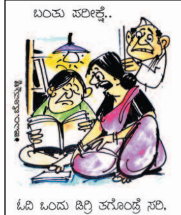
ಬಂಕು ಪರಿಶ್ಕೆ. ಓದಿ ಬಂದು ಡಿಬ್ಬಿ ತಗೊಂಡೆ ಸರಿ. ಇಲ್ಲಾಂತ್ರೆ ನಿಮ್ಮಷ್ಟನ ಹಾಗೇ ಜಿಲ್ಲೆ ರಾಜಕೀಯ ಮಾಡುತ್ತಿರಬೇಕಷ್ಟೆ!