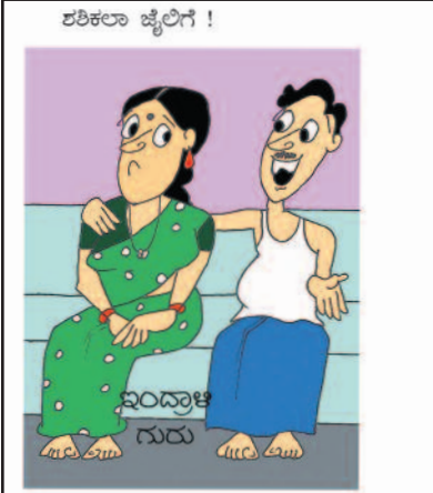
ಶಶಿಕಲಾ ಜೈಲಿಗೆ ! ಮೊದಲು ಜಯಲಲಿತಾ ಅಂತ ಇದ್ದ ನಿನ್ನ ಹೆಸರನ್ನು ಶಶಿಕಲಾ ಅಂತ ಬದಲಾಯಿಸಿಕೊಂಡೆ. ಈಗ ಮನ: ಬದಲಾಯಿಸ್ತಿನಿ ಅಂತಿದ್ದಿಯಲ್ಲೆ.