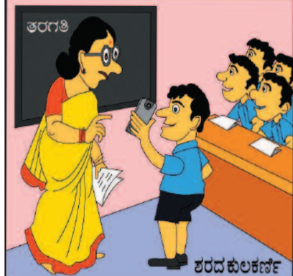
ತರಗತಿ. ತಮಗೆ ಹೇಳದೆ ಚಕ್ರರ್ ಹಾಕಿಲ್ಲ. ಶಾಲೆಗೆ ಬರಲು ಆಗುವುದಿಲ್ಲ ಎಂದು ವ್ಯಾಟ್ಸ್‌ಪ್ ಮೆಸೇಜ್ ಹಾಕಿದ್ದೆ!