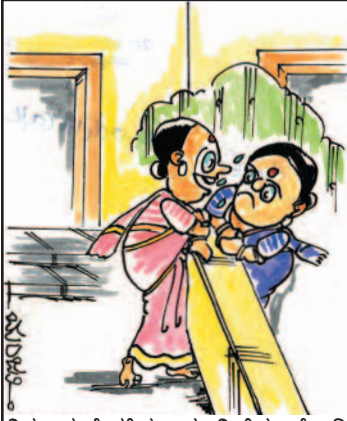
ನಿಮ್ಮ ಮನೆ ಹತ್ತಿರ ಕಾರು ನಿಂತಿದ್ದು ನೋಡಿ ಕಾರು ತಗೊಂಡೇನೋ ಅಂತ ಇದ್ದೆ..! ಬ್ಯಾಂಕಿನವರು ಮನೆ ಜಪ್ತಿಗೆ ಬಂದಿದ್ದಂತೆ!