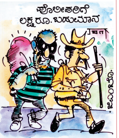
ನಮ್ಮ ಜೊತೆ ಕೈ ಜೋಡಿಸಿದ್ದರೆ ನಾನೇ ನಿಮಗೆ 10 ಲಕ್ಷ ರೂ ಭಕ್ತಿ ಸು ಕೊಡುತ್ತಿದ್ದೆ!