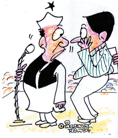
ಹೇಳಿಕೊಳ್ಳಲು ನಮ್ಮ ಸಾಧನ ಏನೂ ಇಲ್ಲ. ಅವರ ಹಾಗರಣಗಳನ್ನೇ ಹೇಳಿ ಬಿಡಿ ಸಾರ್!