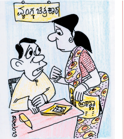
ಭಯವಾಗಿದೆ ಕಣೇ... ಬ್ರಷ್ಟಾಚಾರ ನಿಂತ ವ್ಯಂಗ ಚಿತ್ರ ಬಿಡಿಸೋಕೆ ವಿಷಯ ಎಲ್ಲಿಂದ ತರಲಿ?