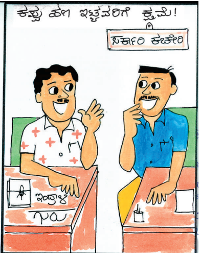
ಲಂಚದ ಹಣ ತಗೊಂಡೊರಿಗೂ ಕ್ಷಮೆ ಇದ್ದಿದ್ದೆ ಚೆನ್ನಾಗಿತ್ತು ಅಲ್ಲಾ?