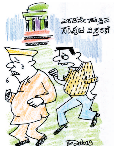
ಸಮಾಧಾನ ಮಾಡ್ಕಿ ಸಾರ್.. ಮಂತ್ರಿ ಮಂಡಲ ಏಳು ಸುತ್ತಿನ ಕೋಟಿ.. ಯಾವುದಾದರೂ ಸುತ್ತಿನಲ್ಲಿ ಸ್ಥಾನ ಸಿಗಬಹುದು!