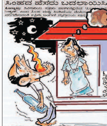
ಇನ್ನಾದರೂ ಸಿಂಹದ ತರಹ ಗರ್ಜಿಸುವುದನ್ನು ನಿಲ್ಲಿಸಿ!