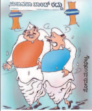
ಪಾರ್ಟಿ ಫಂಡ್ ಇಲ್ಲ, ಅನುದಾನವೂ ಇಲ್ಲ. ದುಡ್ಡಿಲ್ಲದೆ ಮುಂದಿನ ಚುನಾವಣೆಯಲ್ಲಿ ಮತ ಖರೀದಿ ಮಾಡೋದು ಹೇಗೆ ಮಾರಾಯ!