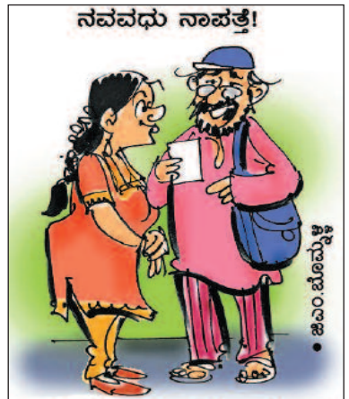
ಪ್ರಿಯಕರನೊಂದಿಗೆ ರಾಣಿಗೆ ಬರುತ್ತಾಳೆ ಅಂತ, ಪೊಲೀಸರೂ ರಾಣಿಯಲ್ಲಿ ಕಾಯುತ್ತಿದ್ದಾರೆ!