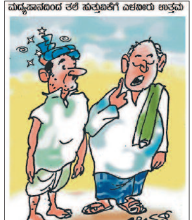
ಅದಕ್ಕೆ ತಲೆ ಸುತ್ತು ಬಾರದಿರಲಿ ಅಂತ ಎಳಸಿರಲ್ಲೇ ತೆಗೆದುಕೊಂಡೆ!