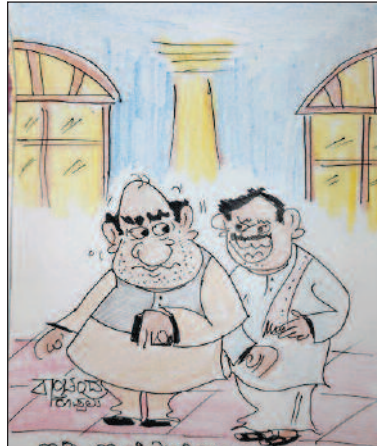
ಇಡೀ ಬಿ.ಟಿ.ಸಿ.ನಿ.ಬಿ. ಸರ್ಕಾರದ ಬಗ್ಗೆ 'ತೆರಿಗೆ ವಸೂಲಾತಿ ಸಾಧ್ಯ!' ಸುಮ್ಮನೆ ನಾನು ಬೆಟ್ಟಕ್ಕೆ ಬಿಟ್ಟು ಸೇರಿ...!!