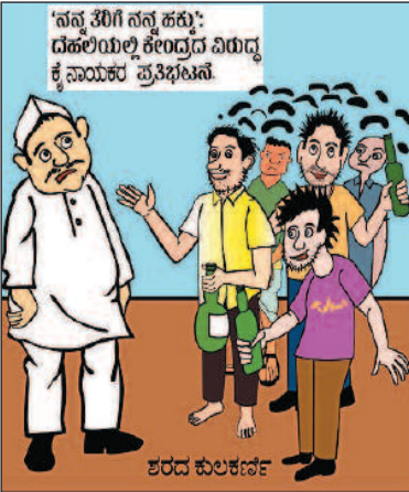
ಮದ್ದದ ಮೇಲಿನ ತೆರಿಗೆ ನಮ್ಮ ಅಭಿವೃದ್ಧಿಗೆ ಬಳಕೆ ಮಾಡಬೇಕು. ತಮ್ಮ ತೆರಿಗೆ ನಮ್ಮ ಹಕ್ಕು!