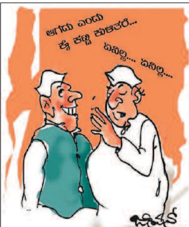
ಶಾಸಕರ ಹಾಡುಗಾರಿಕೆ, ಗಾಯನಗಳಿಂದ ಕೂಡಿದ ಉತ್ತಮ ಸಂಗೀತಮಯ ಬಜೆಟ್!