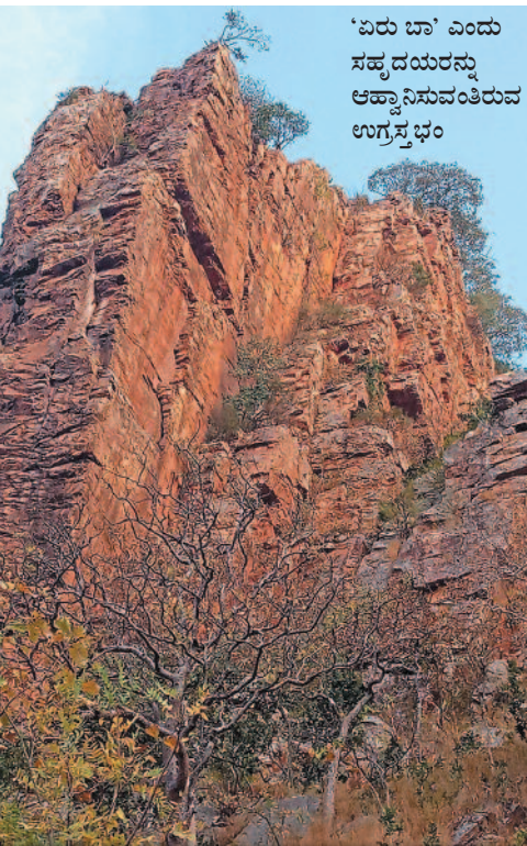
'ಏರು ಬಾ' ಎಂದು ಸಹ್ಯದ ಯರನ್ನು ಆಹ್ವಾನಿಸುವಂತಿರುವ ಉಗ್ರಸ್ತಂಭಂ

ಸೌಲಭ್ಯಗಳೆಲ್ಲ ಇರುವುದು ಕೆಳಗಿರುವ ಚಿನ್ನ ಅಹೋಬಿಲದಲ್ಲಿ. ಆದರೆ ಇಲ್ಲಿ ಆಂಧ್ರ ಟೂರಿಸಂ ಹೋಟೆಲ್ ಬಿಟ್ಟರೆ ವಿಲಾಸಿ ವಸತಿ ಸೌಲಭ್ಯವಿಲ್ಲ. ವಿವಿಧ ಸಮುದಾಯಗಳ ಸಾಧಾರಣ ಭತ್ತಗಳಿವೆ. ಅದೂ ಆ ಸಮುದಾಯದ ಜನರಿಗೆ ಆದ್ಯತೆ. 30 ಕಿ.ಮೀ. ದೂರದಲ್ಲಿರುವ ಅಲ್ಲಗಡ್ಡದಲ್ಲಿ ಒಂದಿಷ್ಟು ಹೋಟೆಲ್‌ಗಳಿವೆ. ಕ್ರೋಧ ನರಸಿಂಹ ಕ್ಷೇತ್ರದಲ್ಲಿ ಬೆಳಿಗ್ಗೆ 9ರಿಂದ ರಾತ್ರಿ 9ರವರೆಗೆ ರುಚಿಕರವಾದ ಉಚಿತ ಪ್ರಸಾದ ವ್ಯವಸ್ಥೆ ಇದೆ. ■