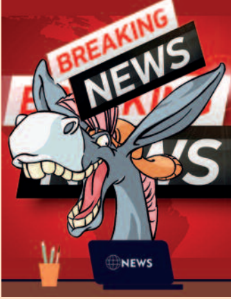
ಆಗ ನಿಜವಾದ ಕತ್ತೆಗಳೇ bray king news ಓದುತ್ತಿದ್ದವು.