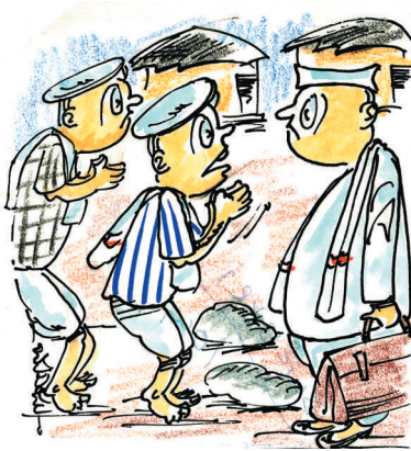
ಈ ಸಲನಾದು ನಮ್ಮ ಹಳ್ಳಿಗೆ ರಸ್ತೆ ಮಾಡಿಸ್ತೀರ ಬುದ್ದಿ? ವಿದೇಶದಲ್ಲಿ ರಸ್ತೆ ಬಗ್ಗೆ ಅದೇನೋ ಅಧ್ಯಯನ ಮಾಡ್ಕೊಂಡು ಬಂದಿದ್ದೀರಂತೆ!