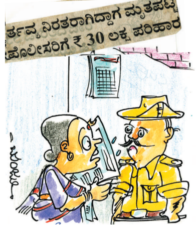
ಆ ಟ್ರಾಫಿಕ್ ನಲ್ಲಿ, ಬಿಸಿಲಲ್ಲಿ ದಿನಾ ಸಾಯೋ ಬದಲು ಇದೆ ಒಳ್ಳೆದು ಅಲ್ಲವೇನಿ?