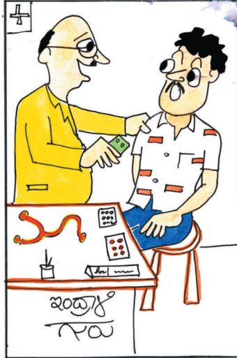
ನಾನು ನಕಲಿ ಡಾಕ್ಟರ್ ಆದೇನು? ಮಾತೆ ಅಸಲಿ ಕೊಟ್ಟಿದ್ದೇನೆ ತಗೊಳಯ್ಯ.