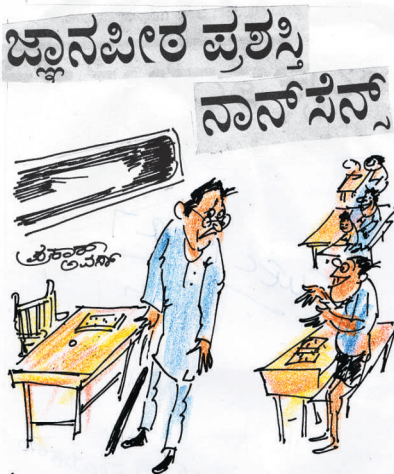
ನಾನ್ ಸೆನ್ಸ್ ಅಂತಾ ನೀವು ನನ್ನನ್ನು ಬಯ್ಯೋದಕ್ಕೆ ನನಗೆ ತುಂಬಾ ಸಂತೋಷ ಸಾರ್. ಅದು ಜ್ಞಾನಪೀಠಕ್ಕೆ ಸಮ ಅಂತ ತಿಳಿಯೋದಿಲ್ಲೇನಿ!