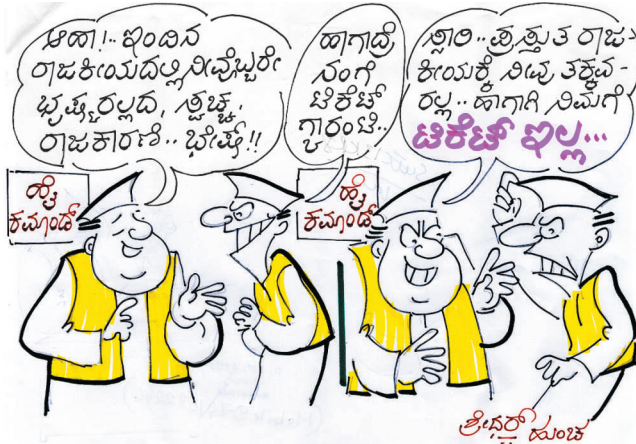
ಆಹಾ!.. ಇಂಥಾ ರಾಜಕೀಯದಲ್ಲಿ ನಿವೃತ್ತರೇ ಭ್ರಷ್ಟರಲ್ಲದ, ಶ್ರೇಷ್ಠ ರಾಜಕಾರಣಿ.. ಭೇಷ್ಯೆ!! ಹಾಗಾದ್ರೆ ನಂಗೆ ಟಿಕೆಟ್ ಗ್ಯಾರಂಟಿ.. ಊ.. ತ್ರೈತ್ಯುತ ರಾಜಕೀಯಕ್ಕೆ ನಿವೃತ್ತರಲ್ಲ.. ಜಾಗಣಿ ನಿಮಗಿಂತ ಟಿಕೆಟ್ ಭಲ್ಲ..