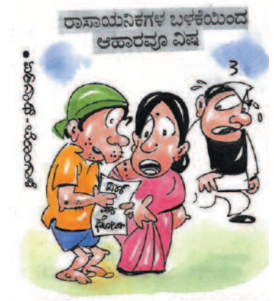
'ಅಪ್ಪೇ ಅಲ್ಲ ಇತ್ತೀಚೆಗೆ ನಮ್ಮವರ 'ಬಾಯಿ ಮಾತುಗಳು' ವಿಷ ಆಗ್ರಿವೆ ಕಣ್ಣೆ'