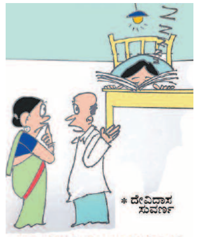
ಎಲ್ಲೂ ಪುಸ್ತಕ ಓದುತ್ತ ಅಭ್ಯಾಸ ಮಾಡಿದರೆ ನಿನ್ನ ಮಗ ನೋಡು ಪುಸ್ತಕ ಮೂಸುತ್ತು ಅಭ್ಯಾಸ ಮಾಡುತ್ತಿದ್ದಾನೆ