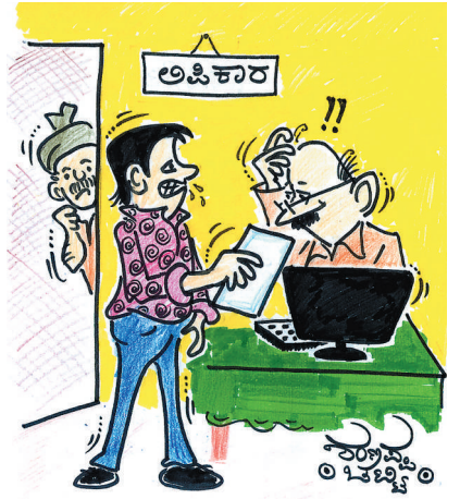
ಇದೇನೀ... ನಮ್ ತಂದೆ ಉದ್ಯೋಗ ಒಕ್ಕಲುತನ ಅಂತ ಬರೆಯೋದಿಟ್ಟು ತಿಕ್ಕಲುತನ ಅಂತ ಬರೆದಿದ್ದೀರಲ್ಲ..!