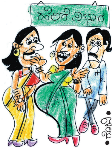
ಮಗುವನ್ನು ನಾನು ಹೆರುವುದಕ್ಕೆ, ಇವು ಸಾಕುವುದಕ್ಕೆಂದು ಮೊದಲ ತೀರ್ಮಾನ ಮಾಡಿಕೊಂಡಿದ್ದೇವೆ