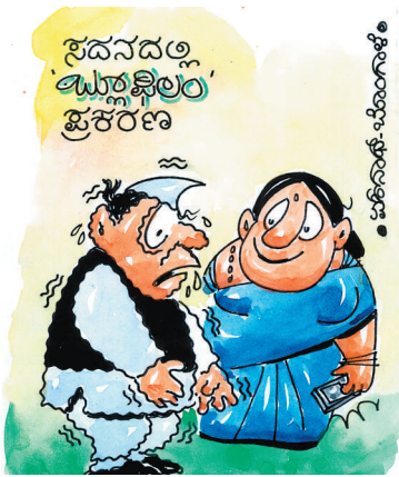
ನನ್ನೆದುರು 'ಬ್ಲಾಕ್ ಪಾರ್ಟಿ' ಉಟ್ಟೊಂಡು ಬರ್ಬೇಡೇ ಭಯವಾಗುತ್ತೆ!