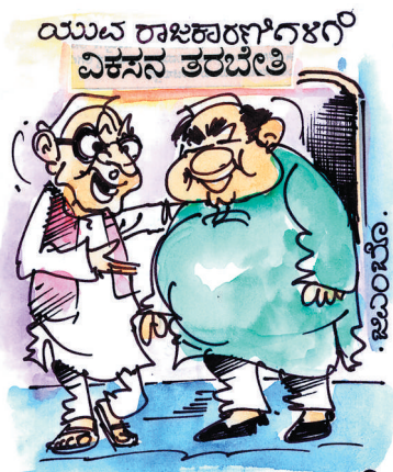
ತಲೆಯಲ್ಲಿ ಏನೇನು ವಿಕಸನ ಆಗಿದೆಯಂತೆ ನೋಡಬೇಕಷ್ಟೆ... ದೇಹವಂತೂ ಒಂದೇ ವಾರಕ್ಕೆ ಇನ್ನಷ್ಟು ವಿಕಸನಗೊಂಡಿದೆ!