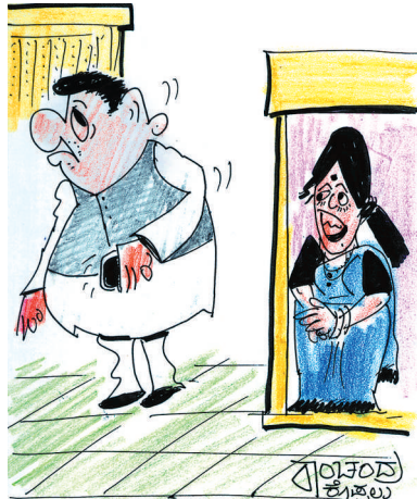
ವಿಧಾನಸಭಾ ಕಲಾಪಕ್ಕೆ ಹೊರಟ್ರಾ... ಸ್ವಲ್ಪ ನಿಮ್ಮ ಮೊಬೈಲ್ ಕೂಡಿ.. ನೋಡಿ ಕೂಡೋನಿ!