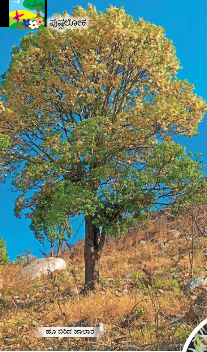
ಹೂ ಬಿಡಿದ ಜಾಲಾರ