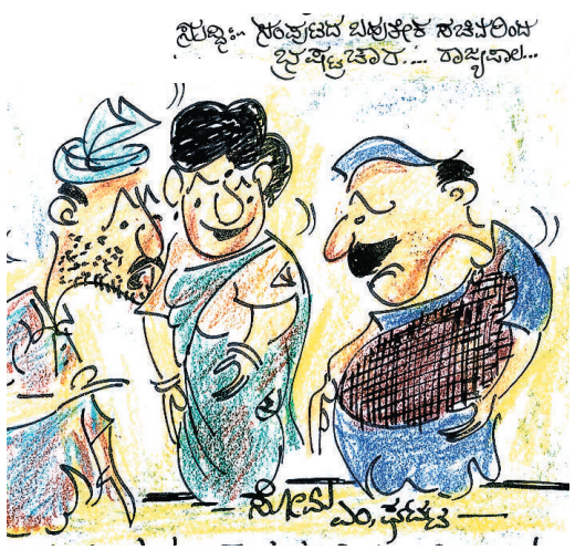
ನೀವೇನು ಭ್ರಷ್ಟಾಚಾರ ಮಾಡಿಲ್ಲ ಬಡಿ ಸ್ವಾಮಿ.. ಬರೀ ಸೀರೆ.. ಹೆಂಡ.. ಹಣ ಮಾತ್ರ ಕೊಟ್ಟಿದ್ದೀರಿ ಭೂಮಿ ಕೊಡ್ಲಿಲ್ಲ..!