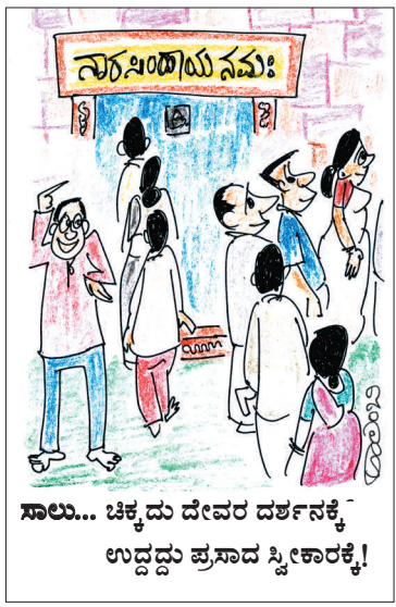
ಸಾಲು... ಚಿಕ್ಕದು ದೇವರ ದರ್ಶನಕ್ಕೆ ಉದ್ದದ್ದು ಪ್ರಸಾದ ಸ್ವೀಕಾರಕ್ಕೆ!