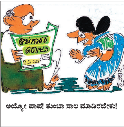
ಅಯ್ಯೋ ಪಾಪ! ತುಂಬಾ ಸಾಲ ಮಾಡಿರಬೇಕು!