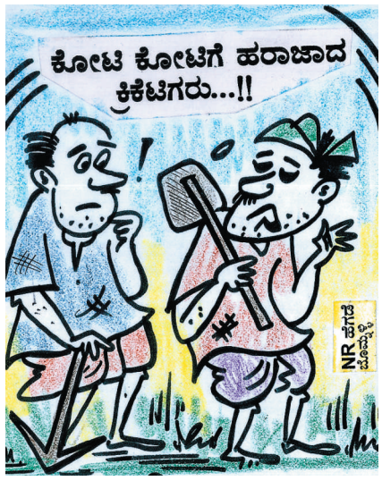
ತೋಟ... ಗದ್ದೆಯಲ್ಲಿ ಬೆವರು ಸುರಿಸುವ ಬದಲು ಆಟದ ಬಯಲಿನಲ್ಲಿ ಸುರಿಸಿದೆ.. ಸಾಲದ ಬದ್ದು ಕೋಟಿ ಮಾಡ್ಬೋದಿತ್ತು..!