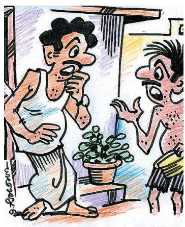
ನಿಮ್ಮ ಹೆಂಡತಿಯ ಹೊಸ ರುಚಿ ತಿಂದು ತಿಂದು ಹೊಟ್ಟೆ ಕೆಟ್ಟಿದೆ, ಡಾಕ್ಟರ್ ಹತ್ತಿರ ಹೋಗಬೇಕು. ಐನೂರು ರೂಪಾಯಿ ಕೊಡಿ ಸಾರ್..