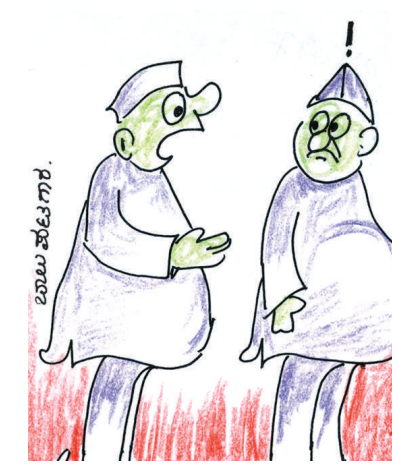
ಎಲ್ಲರೂ ಮಾತೃಪಕ್ಷಕ್ಕೆ ಮರಳುತ್ತಾ ಇದ್ದಾರೆ; ನನ್ನ ಮಾತೃಪಕ್ಷ ಯಾವುದೆಂಬುದೇ ಮರೆತುಹೋಗಿದೆ!