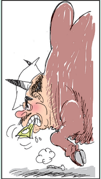
Full ತಿಂದು ಹಾಳುಗುಡವುತ್ತಾನೆ!

ಹಾಡ್ಯ ಜಯಾನಂದ, ಮೈಸೂರು ಹುಲ್ಲು ತಿಂದು ಹಾಲು ಕೊಡುತ್ತದೆ ಆಕಳು. ಓಟು ಪಡೆದ ರಾಜಕಾರಣಿ?