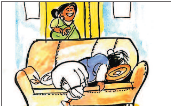
ಲೇವಣಿ ಕಳೆದುಕೊಂಡವರಂತೆ ಮಹಾಡೆ ಮಲಗಿದ್ದೀರಲ್ಲ, ಇನ್ನೂ ನಿಮಗೆ ಟೆಕೇಟ್ ಸಿಕ್ಕಿಲ್ಲ!