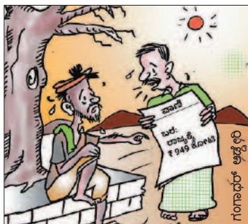
ಇದನ್ನು ನೋಡಿದ ಮೇಲೆ ನಮ್ಮ ಪ್ರತಿನಿಧಿ ಖಂಡಿತಾ ಬಂದೇ ಬರ್ತಾರೆ ಬೋರಣ್ಣಾ