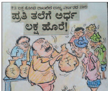
ಬೋರಾ, ಇದು ನಮ್ಮ ಮೈತ್ರಿ ಸರ್ಕಾರದ ಕೊಡುಗೆ