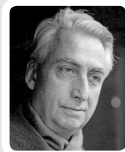
ಗ್ರೇಟಾಳ ಬಗ್ಗೆ 'ದಿ ಫೇಸ್ ಆಫ್ ಗಾರ್ಡ್ಲ್ಯಾ' ಎನ್ನುವ ವಿಶೇಷ ಲೇಖನ ಬರೆದ ರೋಲಾಂಡ್ ಬಾರ್ತ್