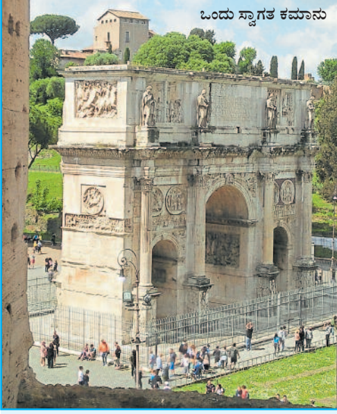
ಒಂದು ಸ್ವಾಗತ ಕಮಾನು