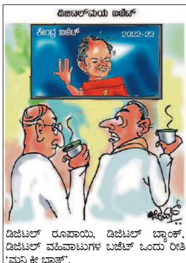
ಡಿಜಿಟಲ್ ರೂಪಾಯಿ, ಡಿಜಿಟಲ್ ಬ್ಯಾಂಕ್, ಡಿಜಿಟಲ್ ವಹಿವಾಟುಗಳ ಬಜೆಟ್ ಒಂದು ರೀತಿ 'ಮನಿ ಕೇ ಬಾತ್'.