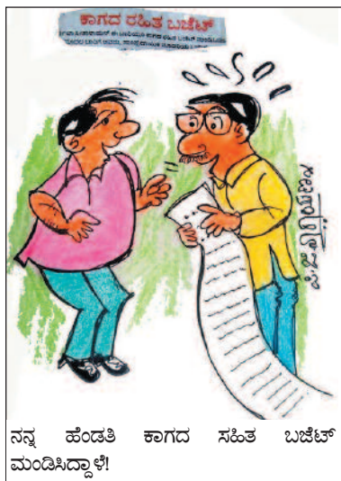
ನನ್ನ ಹೆಂಡತಿ ಕಾಗದ ಸಹಿತ ಬಜೆಟ್ ಮಂಡಿಸಿದ್ದಾಳೆ!