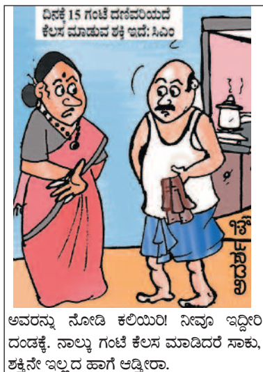
ಅವರನ್ನು ನೋಡಿ ಕಲಿಯಿರಿ! ನೀವೂ ಇದ್ದೀರಿ ದಂಡಕ್ಕೆ. ನಾಲ್ಕು ಗಂಟೆ ಕೆಲಸ ಮಾಡಿದರೆ ಸಾಕು, ಶಕ್ತಿನೇ ಇಲ್ಲದ ಹಾಗೆ ಆಡ್ತೀರಾ.