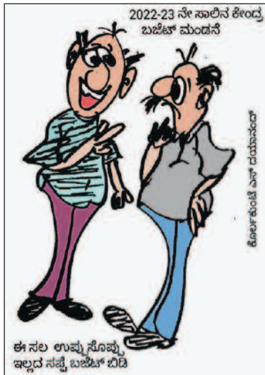
ಈ ಸಲ ಉಪ್ಪು ಸೊಪ್ಪು ಇಲ್ಲದ ಸಪ್ಪೆ ಬಜೆಟ್ ಬಿಡಿ