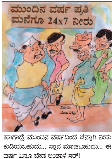
ಹಾಗಾದ್ರೆ ಮುಂದಿನ ವರ್ಷದಿಂದ ಚೆನ್ನಾಗಿ ನೀರು ಕುಡಿಯಬಹುದು... ಸ್ನಾನ ಮಾಡಬಹುದು... ಈ ವರ್ಷ ಏನೂ ಬೇಡ ಅಂತಾಕೆ ಸರ್!