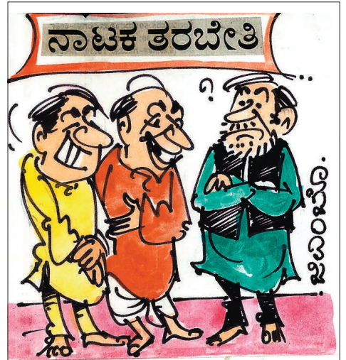
ಉಳಿದಲ್ಲ ಬಿಟ್ಟು ರಾಜಕೀಯ ಸೇರೋನಿ ಅಂತಿದ್ದಾನೆ. ಅದೈ ನಟನೆಯೂ ಗೊತ್ತಿತ್ತೆ ಅನುಕೂಲ ಅಂತ..?