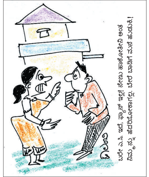
ಬರೆ ಎ.ಪಿ. ಇದ್. ಫ್ಯಾನ್ ಇಲ್ಲ! ನೇಣು ಹಾಕೋತೀನಿ ಅಂತ ನಿಮ್ಮನ್ನು ಹೆದರಿಸೋಣಾಗಲ್ಲ. ಬೇರೆ ಬಾಡಿಗೆ ಮನೆ ಹುಡುಕಿ!