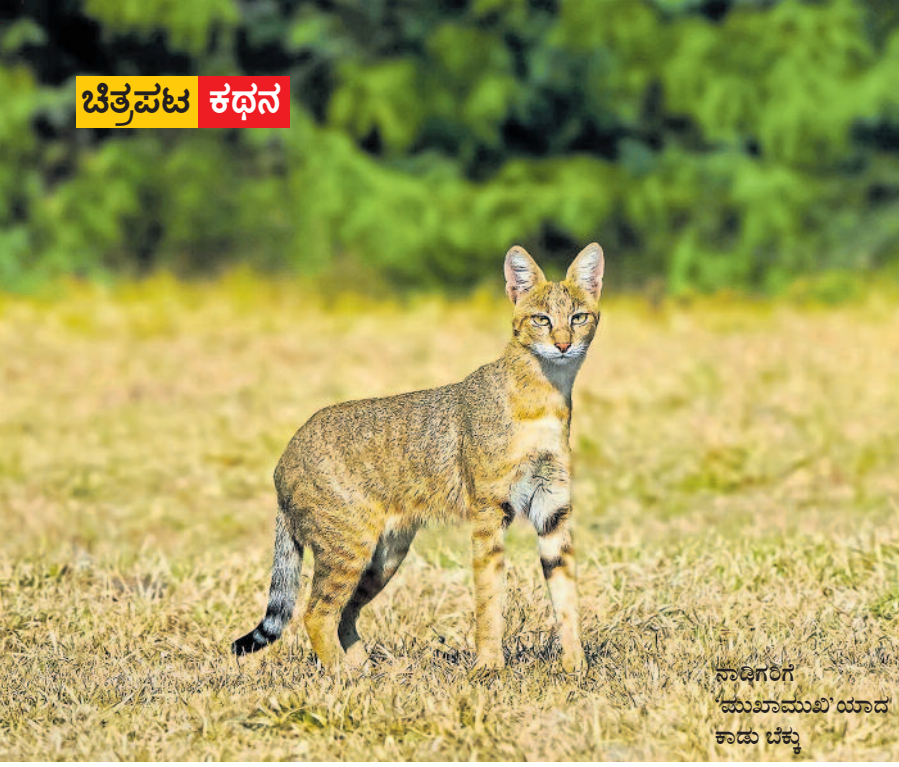
ನಾಡಿಗರಿಗೆ 'ಮುಖಾಮುಖಿ' ಯಾದ ಕಾಡು ಬೆಕ್ಕು