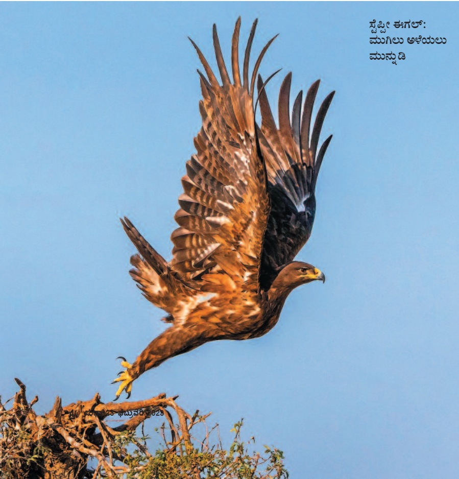
ಸೆಪ್ಟೀ ಈಗಲ್: ಮುಗಿಲು ಅಳಿಯಲು ಮುನ್ನುಡಿ

ರಾಜಸ್ಥಾನಿ ಭಾಷೆಯಲ್ಲಿ 'ತಾಲ್' ಪದದ ಅರ್ಥ ಸಮತಟ್ಟಾದ ಭೂಮಿ. ಮಳೆಯ ಸಮಯದಲ್ಲಿ