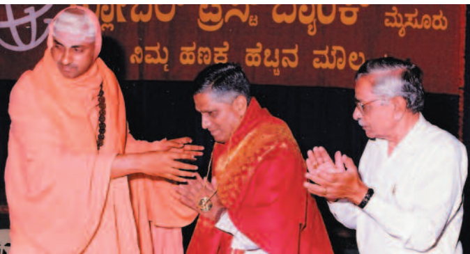
ಮೈಸೂರಿನಲ್ಲಿ 'ವಿದ್ವಾನ್' ಪ್ರಶಸ್ತಿ ಸ್ವೀಕರಿಸುವ ಕ್ಷಣ.

'ಒಂದ್ರು, ಕೆ.ಆರ್.ನಗರದಲ್ಲಿ ನನ್ನ ಕಛೇರಿ ಏರ್ಪಡಿಸಿದ್ದು. ವೇದಿಕೆ ಮೇಲೆ ಕುಳಿತ್ಕೊಂಡು ಪಿಟೀಲು ನುಡಿಸಲು ಶುರುಮಾಡ್ತಾಗ, ಏನಿದು ಹಾಡು ಹೇಳಿ ಅಂದ್ರು ಕುಯ್ಯಕ್ಕೆ ಶುರು ಮಾಡಿದ್ದು, ಸ್ವಾಮೀ ಹಾಡು ಹೇಳಿ ಅಂದ್ರು. ಸರಿ ಅಂತ, 'ರಾಮ ನನ್ನ ಬ್ರೋವರಾ' ಹಾಡಿದೆ. ಆಗ ಅವರು 'ಸ್ವಾಮೀ ಈಗ್ಗೂ ನಮಗೆ ಏನೂ ಅರ್ಥ ಆಗಿಲ್ಲ ಅಂದ್ರು. ಕನ್ನಡದಲ್ಲಿ ಹೇಳಿ ಅಂದ್ರು. ಇನ್ನೊಬ್ಬ, ಸ್ವಾಮೀ ನಿಂತೊಂಡು ಹೇಳಿ ಅಂದ. ಸರಿ ನಿಂತೊಂಡು, ಅರ್ಥ ಹೇಳ್ತಾ ಹಾಡು ಹೇಳ್ತೆ..' ಹೀಗೆ ಕಛೇರಿಯಲ್ಲಿ ಅರ್ಥ ಹೇಳ್ತಾ ಹಾಡಿದ್ದು ಮರೆಯಕ್ಕೆ ಸಾಧ್ಯವಿಲ್ಲ.