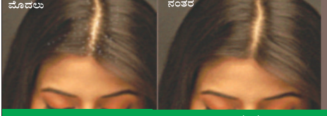
ಮೊದಲು ನಂತರ ಅವಧಿಗೆ ಮುಂಚೆ ಬಿಳಿಕೂದಲು ಒತ್ತಡ