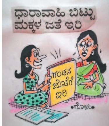
ಅಮ್ಮಾ ನನಗೆ ಓದಲು ಬಿಡು... ನೀನು ಇದನ್ನು ಓದು!