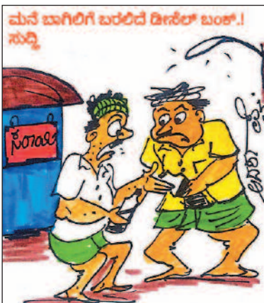
ಡೀಸೆಲ್ ಬಂಕ್ ಬರುತ್ತಾ ಇದೆ ಅಂದ್ರೆ ಮುಂದೆ ಲಿಕ್ವರ್ ಬಂಕ್ ಬರಬಹುದು ಅಲ್ಲೇನೋ...?