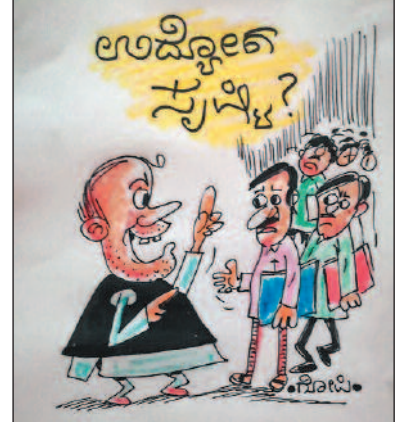
ಪ್ರತಿಭಟನೆ, ಸಮರ್ಥನೆಯ ರಾಜಿಗಳೆಂದು ಹಲವಾರು ಕೆಲಸಗಳು ಸ್ಪಷ್ಟವಾಗಿಲ್ಲವೇ?