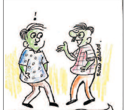
ನನಗಿ ನೂತನ ಪುಟುಗಳು ಇದ್ದಾರೆ, ಇವತ್ತು ಎಲ್ಲವೂ ಬಿಟ್ಟು ಬಿಡು. ಓದಿ ಕೊಟ್ಟಿದ್ದೇನೆ!