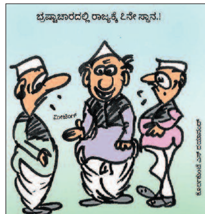
ಏನಾದರೂ ಮಾಡಿ ಮೊದಲನೇ ಸ್ಥಾನಕ್ಕೆ ಬರಲು ನಾವು ಪ್ರಯತ್ನ ಮಾಡಲೇಬೇಕು