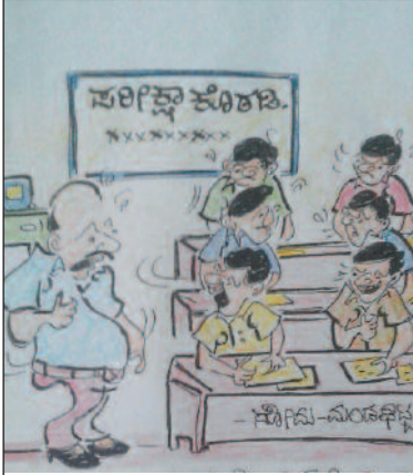
ಅಲ್ಲಿ ಕುರ್ಚಿ ಇದ್ದು ಸುಮ್ಮನೆ ಆ ಕಡೆ ಈ ಕಡೆ ಓಡಾಡುತ್ತಿರಲಿಲ್ಲ ಸಾರ್...!!