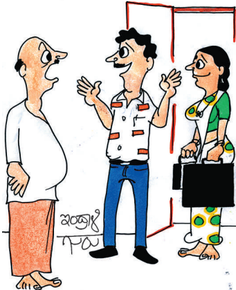
ಬಸ್‌ನಲ್ಲಿ ದುರಂತ ಆಗೋದು ಬೇಡಾಂತ ಊರಿಂದ ಆಟೋ ಮಾಡ್ಕೊಂಡು ಬಂದ್ವಿ. ಬೇಗ ಆಟೋ ಬಾಡಿಗೆ ಕೊಟ್ಟು ಬನ್ನಿ ಮಾವ. ಅವರನ್ನು ಕಾಯಿಸೋದು ಬೇಡ!