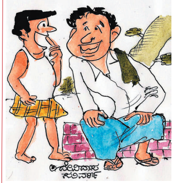
ಹಾಗಾದರೆ ನಮ್ಮ ಪ್ರತಿ ವೋಟಿಗೆ ಹೆಚ್ಚಿಗೆ ಹಣ ಸಿಗುತ್ತದೆ ಅಂತಾಯ್ತು!