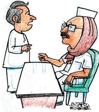
ಜನರು ಹೋರಾಟಕ್ಕಿಳಿಯುವುದಕ್ಕಿಂತ ಮುಂಚೆ ನಾವೇ ಧರಣಿಗೆ ಕುಳಿತರೆ ಜನರಲ್ಲಿ ನಮ್ಮ ವಿರುದ್ಧ ಅಭಿಪ್ರಾಯ ಮೂಡುವುದು ತಪ್ಪುತ್ತದೆ!