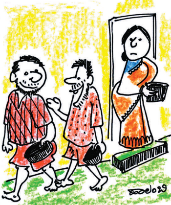
ರೂಪಾಯಿಗೆ ಅಕ್ಕಿ ಸಿಗುತ್ತಿಲ್ಲಾ..? ಅದಕ್ಕೇ.. ಮೂರು ದಿನದಿಂದ ಊಟ ಮಾಡಿಲ್ಲ ಅನ್ನಬಾದು. 'ಹೋಟೆಲ್‌ಗೆ ಹೋಗಿಲ್ಲ ದಾನ ನೀಡಿ' ಅನ್ನಬೇಕು.. ಅಲ್ಲೇನೋ!