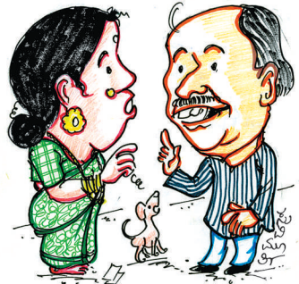
ಆದ್ರೆ ಪೋಲಿಗಳಿಂದ ಮುಕ್ತ ಭಾರತ ಮಾಡ್ಲಿಕ್ಕೆ ಖಂಡಿತಾ ಇವರ ಕೈಲಿ ಆಗಲ್ಲ..