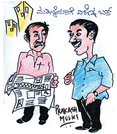
ಇನ್ನು ಅವರ ಬಸ್‌ಗಳಿಂದ ಶಬ್ದ ಮಾಲಿನ್ಯ!