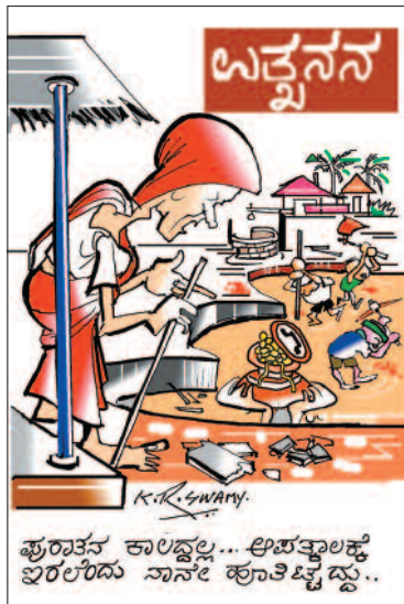
ಪುರಾತನ ಕಾಲಿಲ್ಲ... ಅಶುದ್ಧತೆಗೆ ಲಕ್ಷ್ಮೀನ ಸಾಸೇ ಲಕ್ಷ್ಮೀನು..

ಪತಿ: ದೇವರ ಹತ್ತಿರ ಏನು ಕೇಳಿಕೊಂಡೆ? ಪತ್ನಿ: ಏಳೇಳು ಜನ್ಮಕ್ಕೂ ನೀವೇ ಪತಿಯಾಗಬೇಕು ಎಂದು. ಪತಿ: ಹೌದಾ? ಪತ್ನಿ: ನೀವು? ಪತಿ: ನಿನ್ನ ಬೇಡಿಕೆ ಈಡೇರದಿರಲಿ ಎಂದು. ಪತ್ನಿ: ಯಾಕೆ? ಪತಿ: ಮತ್ತೆ ದೇವರು ಒಂದು ಸಲ ಮಾತ್ರ ವರ ಕೊಡ್ತಾನೆ ಅದಕ್ಕೆ.