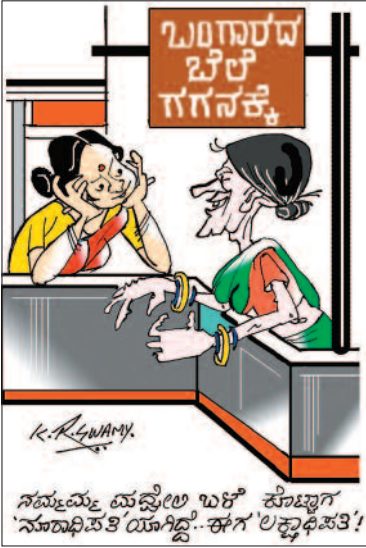
ಸಮ್ಮೇಷ್ಣತೆ ಮತ್ತು ಉಚಿತ ಸೌಜನ್ಯ 'ನಾಡುಭಿಕ್ಷುತೆ ಯೋಗಿದ್ದು... ಈಗ' ಲಕ್ಷ್ಮೀಪತಿ!

ಮಗ: ಅಪ್ಪ, ತೋಟವನ್ನು ನನ್ನ ಹೆಸರಿಗೆ ಮಾಡಿಸಿ ಎಷ್ಟು ವರ್ಷ ಆಯಿತು. ತಂದೆ: ಒಂದು ವರ್ಷಾತು ಯಾಕೆ? ಮಗ: ಸುಮ್ಮನೆ ಕೇಳಿದೆ. ಕೆಲ ತಿಂಗಳ ನಂತರ. ಮಗ: ಅಪ್ಪ, ಹೊಸ ಕಾರು ತಂದೀನಿ ಬಾ... ತಂದೆ: (ಗಾಬರಿಯಿಂದ) ಅದ್ದೆಂಗ, ಹೇಗೆ ತಂದಿ. ಮಗ: ಅದಲ್ಲ ಇರಲಿ ಆಮೇಲೆ ಹೇಳೋನಿ. ಕಾರು ಹತ್ತು, ಒಂದ್ ರೌಂಡ್ ಹೋಗಿ ಬರೋಣಂತ. ತಂದೆ: ಸರಿ ಸರಿ. ಮಗ: ಎಲ್ಲಿಗೆ ಹೋಗೋಣ... ತಂದೆ: ನಮ್ಮ ತೋಟದ ಕಡೆಗೆ ಬಿಡು. ಮಗ: ಅಪ್ಪ ತೋಟ ಮಾರೀನಿ...!