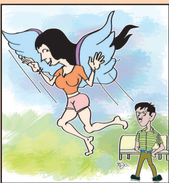
ರೆಕ್ಕೆ ಬಲಿತಾಕ್ಷಣ ಹಾರಿಹೋಗುವ ಗುಣ ಇರುವುದರಿಂದ.